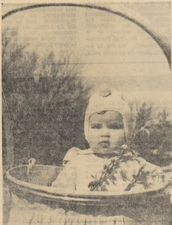
Frunze, flori și... boboci