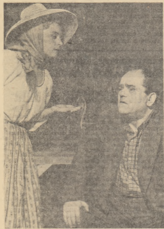
O scenă din piesa „Nuntă la castel”.

Sondorii întreprinderii de foraj din Rimnicu Vilcea obțin succese importante în extinderea forajului cu turbina. Folosind turbina triplă sondorii vilcenii au forat, de exemplu, sonda 260 la peste 3.200 metri adîncime. Aplicînd forajul cu turbina și realizînd astfel viteze de lucru superioare, brigăzile de foraj terminat săparea sondelor 150, 368 și 411 cu 8-13 zile înainte de termen obținînd economii de peste 150.000 de lei la fiecare sondă.