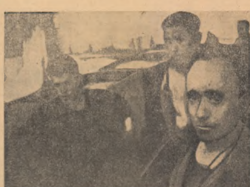
Agapi din cadrul puternicii mișcări greviste care răstoarnă Spania. Muncii greviști la minele din Aragon.

terii conducerii organizațiilor studențești de către Ministerul Educației Naționale au continuat în cursul zilelor de 14 și 15 mai.