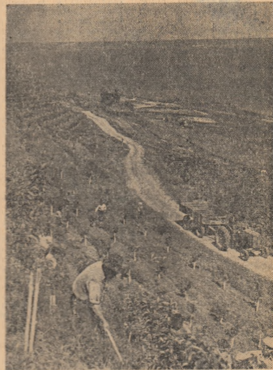
Livada de piersici plantată în terase la Stațiunea experimentală Greaca, va da, în urma lucrărilor de întreținere ce se execută acum, un rod bogat.

Oamenii muncii din întreprinderile industriale ale regiunii Iași și alături de ei tinerii, participă cu avînt la întrecerea socialistă pentru îndeplinirea angajamentelor luate. Pînă acum, de exemplu, metalurgistii din Birlad și-au depășit sarcinile de producție cu 20 la sută. În frunte se află colectivele secțiilor rectificării și montaj și bile-rol.