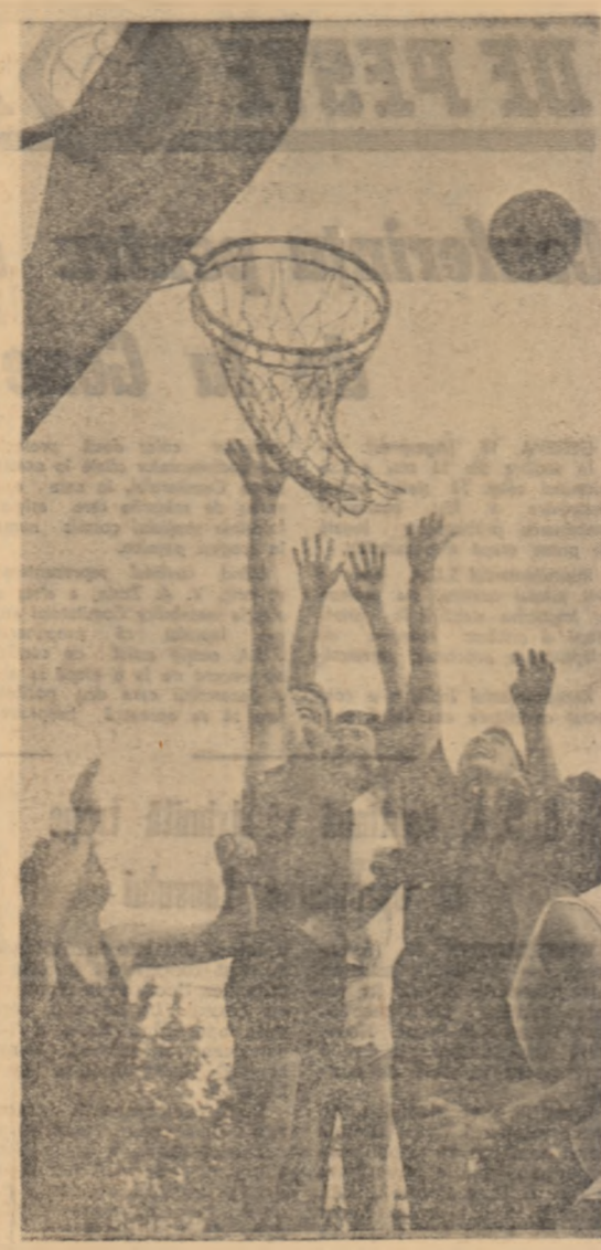
Meci de baschet susținut de elevii clasei a X-a de la Școala medie nr. 1 din Timșoara