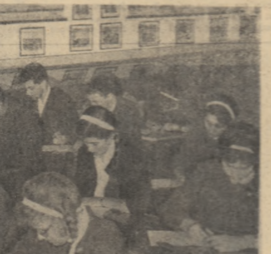
Lucrare de control trimestrială la o clasă a XI-a a Școlii medii „Georgehe Lezăr” din Capileș.