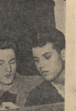
O grup de înfrățitorii la Școala medie serală a Atelierele de reparat material rulant din Iași.