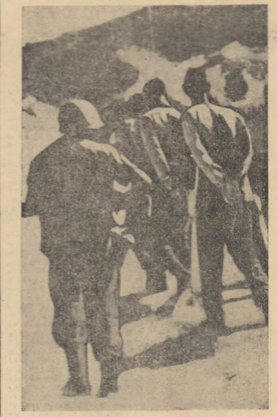
Venezuela. După înăbușirea răscoalei împotriva regimului reacționar al lui Belencourt un grup de marinari arestați sînt duși într-un lagăr de concentrare.

Miercuri dimineață, oaspețele americane pleacă la Kiev.