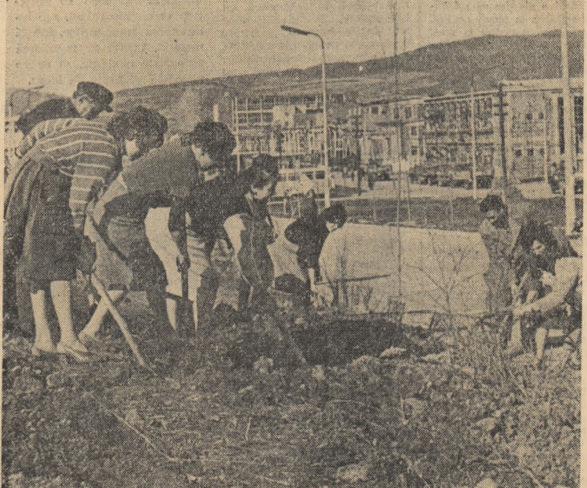
În timpul liber, tinerii de la Combinatul chimic din Borzești participă cu însuflețire la acțiunile de muncă patriotică pentru înfrumusețarea combinatului lor.