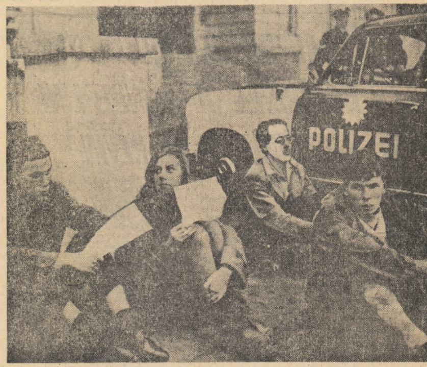
Pășuri largi ale populației din R.F.G. se pronunță pentru apărarea păcii. În fotografia de sus: La Hamburg în timpul unui marș al păcii participanți au protestat împotriva experiențelor nucleare americane și împotriva înarmării atomice a R.F.G. În fotografia de jos: Studenți din același oraș în fața consulatului S.U.A. cer încetarea imediată a experiențelor nucleare ale S.U.A.