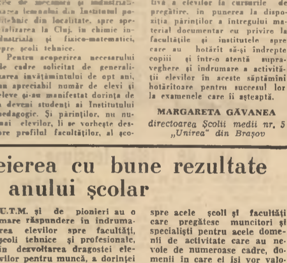
U.T.M. și de pionieri au o mare răspundere în îndrumarea elevilor spre facultăți, școli tehnice și profesionale, în dezvoltarea dragostei elevilor pentru muncă, a dorinței de a lucra nemijlocit în producție, de a se forma la marea școală a muncii, în fabrici și uzine, în gospodăriile agricole colective. Prin gazele de presă, panouri, stații de radioamplificare, prin discuții individuale, organizațiile U.T.M. au posibilitatea să-și ajute pe viitorii absolvenți să se îndrepte