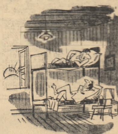
— Tîra scrișit palul? — Nu... Eu n-am putut dormi din cauza parajilor din perni.