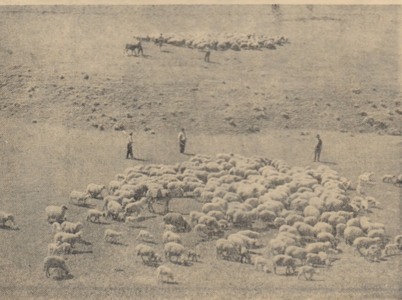
Pentru industrie — mai multă lână fină și semilună. La G.A.S. Botoșani-Pala, regiunea Oltenia, se acordă o deosebită atenție creșterii oilor. În fotografie: la pășune, o parte din turma de 8.000 de oi a gospodăriei.