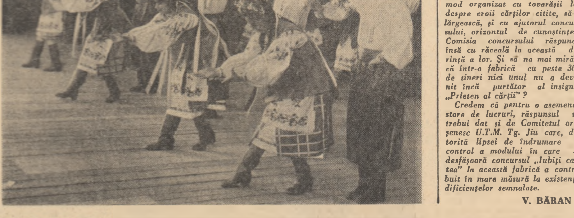
Echipa de dansuri a întreprinderii „Sera Rahova” din Capitală prezintă o sală de dans pe scena Teatrului de vară din parcul Huedin.

a grupii în care studenții din diferite facultăți prezintă programe culturale-educative. ION MEDOIA student