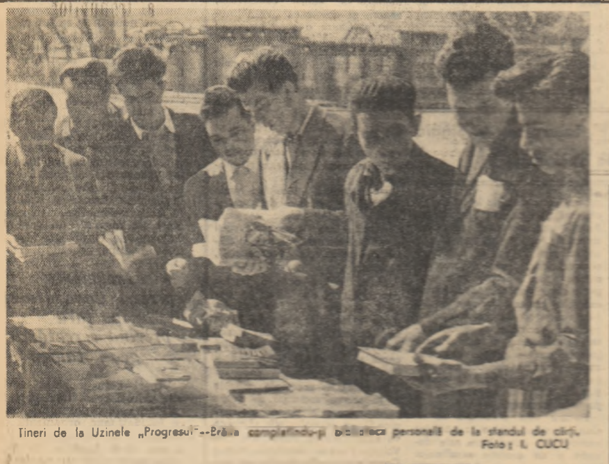
Tineri de la Uzinele „Progresul” — Erău completându-și biblioteca personală de la standul de cărți.