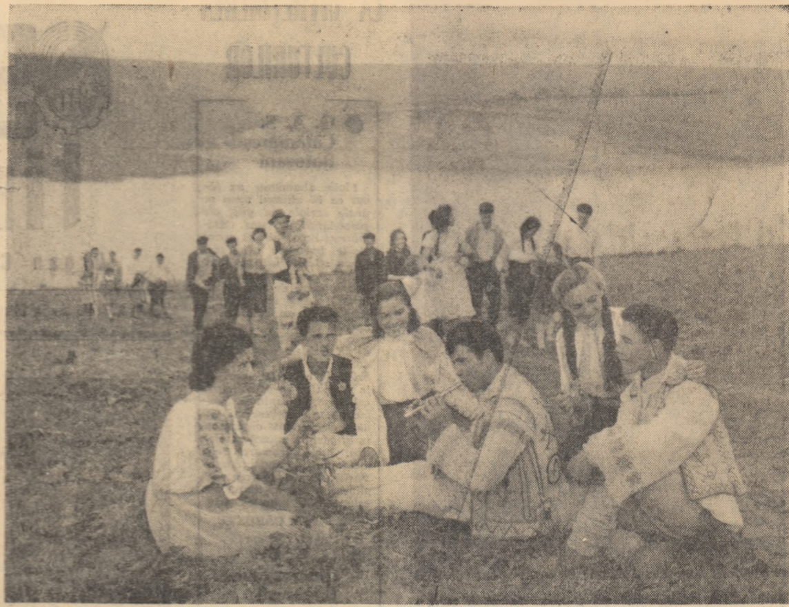
Preliudiu unei hore într-o duminică la Toloșți, raionul Hirău.

„Procesul kilogramelor” se vorbește în mod deosebit de actualitatea dar pe date generale. E un program, cum s-ar zice de „concurs”. Conține totuși părți care pot fi adaptate cu ușurință la problemele fiecărei săptămîni. Tinerii pot contribui mult la îmbunătățirea programelor de duminică ale căminului cultural din Răcăciuni. În acest sens, comitetul organizatorilor U.T.M. pe C.A.C. (secretar Nicolae Niță) trebuie să dea mai multă atenție participării tinerilor ca organizatori la activitățile culturale. Muncile la cîmp se încheie. Activitatea cultural-educativă trebuie să vină în sprijinul producției, al colectivităților, pentru a-și putea să-și formeze și să-și dezvolte o conștiință nouă, socială. Ca să-l facă în săptămîna care a trecut? Care echipă, care brigadă de cîmp a prînzului mai bine? Pe cine o să-l laude, pe cine o să-l critice brigada artistică de apăsare în programul „Folger” de 10-15 minute? Ce statură are de cel agronom pentru săptămîna asta? Ce carte nouă a apărut în bibliotecă? La ce doar citim, într-un timp care trebuie să dea răsunet activității culturale de la cămin. Alteori cînd trebuie să luăm în mîna, să-l laudăm și să-l criticăm, să-l învețe ceva nou, să-l îmbogățim cunoștințele. Căminul cultural din Răcăciuni răspunde doar în parte a acestor cerințe. G. NANCU