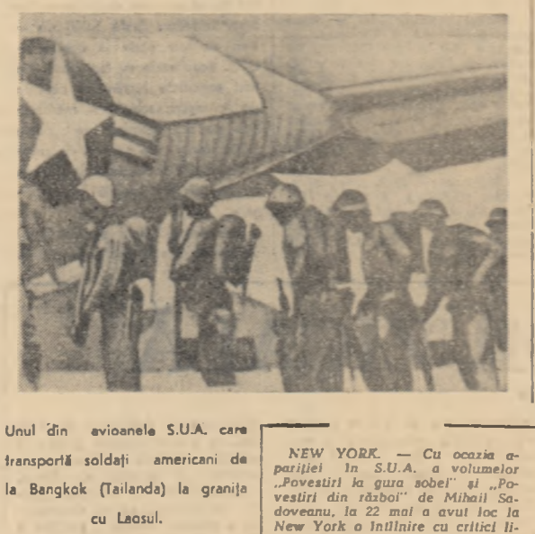
Unul din avioanele S.U.A. care transportă soldați americani de la Bangkok (Tailanda) la granița cu Laosul.

F.M.T.D. cheamă tineretul întregii lumi să lupte împotriva acțiunilor agresive și provocatoare ale imperialismului american și să ceară evacuarea imediată a forțelor armate americane din Asia de Sud-Est. Problemele Laosului, se subliniază în declarație, trebuie să fie rezolvate numai de laotieni.