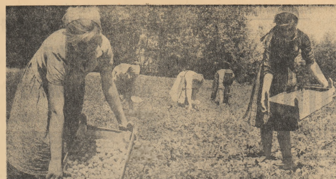
Colectivii din comuna Dirvari, regiunea București, au început culesul căpșunilor.

8. „Călăuza și instrucțiunile de lucru la mașina de tricotat circulară Interlok”. Traducere din limba germană — I.D.T. București.