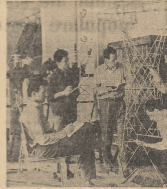
Studenții Institutului politehnic din București se pregătesc pentru examene în laboratoarele de rețele electrice și electricitate.