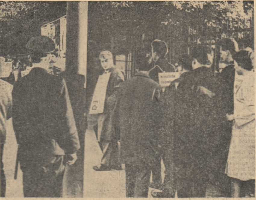
Aspect de la o demonstrație la Frankfurt pe Main (R.F.G.) împotriva experiențelor nucleare americane din Pacific și împotriva reînvierei militarismului în Germania occidentală.

„După cite se pare — arată ziarul francez „L’Aurore” — în America lucrurile nu merg bine. Zilele următoare vor fi extrem de dificile pentru Wall Street și pentru Europa (occidentală n.r.) în general”.