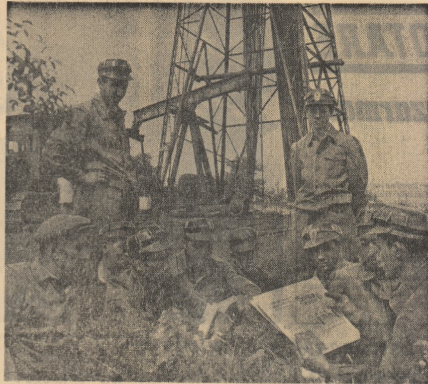
Au sosit ziarele. În pauză petroliști din școala Boldești, Ploiești obșnuiesc să facă lectura presei în colectiv.