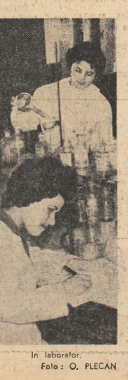
În laborator.

Șantierea navală Constanța. Echipa de nițuitori de la secția navală, condusă de Cristea Manea, este înfrunțată în operațiunile de intervenție rapidă la locurile defecțiunilor.