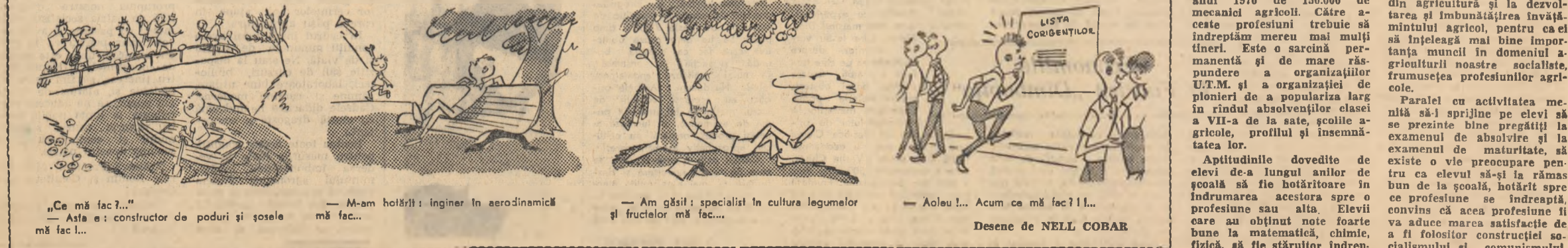
„Ce mă fac?...” — Asta e: constructor de poduri și șosele mă fac... — M-am hotărât: inginer în aerodinamică mă fac... — Am găsit: specialist în cultura legumelor și fructelor mă fac... — Aoleu!... Acum ce mă fac?!... Desene de NEL COBAR