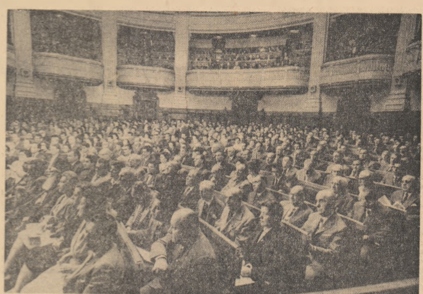
În timpul lucrărilor

La Palatul Marii Adunări Naționale s-au deschis, vineri dimineață, lucrările Adunării reprezentanților mișcării pentru pace din R. P. Romînie. Au luat parte peste 800 de delegați și invitați din întreaga țară — eroii ai Muncii Socialiste, muncitori, ingineri și tehnicieni, colectivități, lucrători din gospodării agricole de stat și stațiuni de mașini și tractoare, conducători ai unor instituții de stat și organizații obștești, academicieni, oameni de știință, cultură și artă, reprezentanți ai cultelor, studenți, pensionari, gospodine, ziaristi romîni și străini.