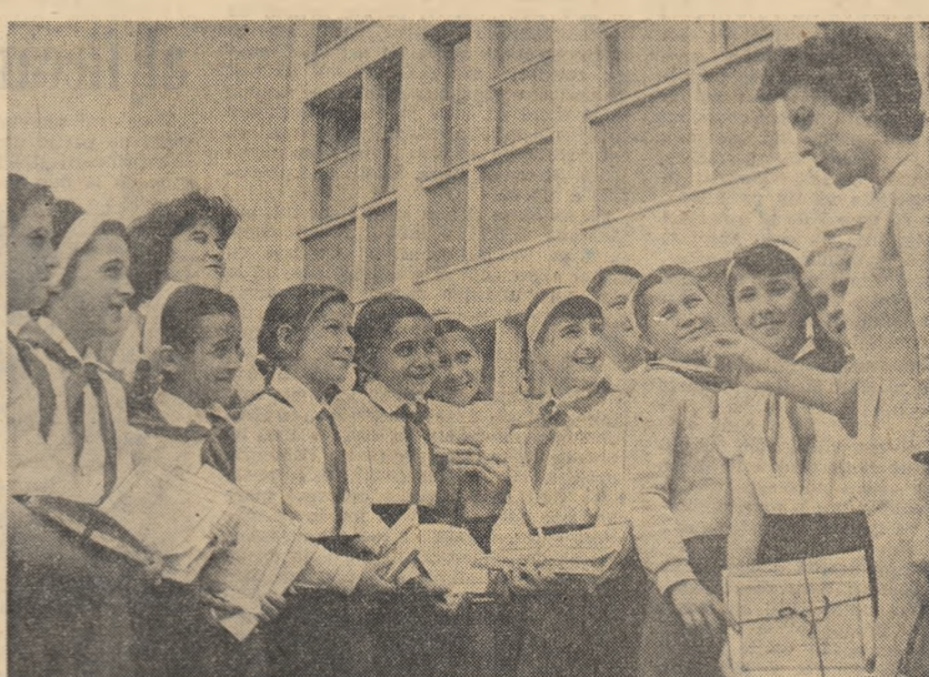
Aspect de la serbarea de sfîrșit de an a Școlii medii nr. 38 din Capitală.