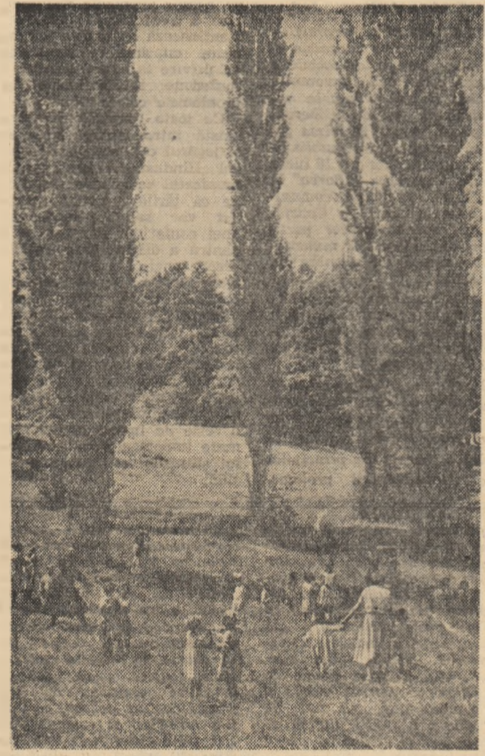
Vedere din Parcul poporului — Craiova.

Spectacolul a fost primit cu multă căldură. Artiștii amatori militari le-au fost oferite flori din partea Ministerului Forțelor Armate ale R. P. Române. (Agerpres)