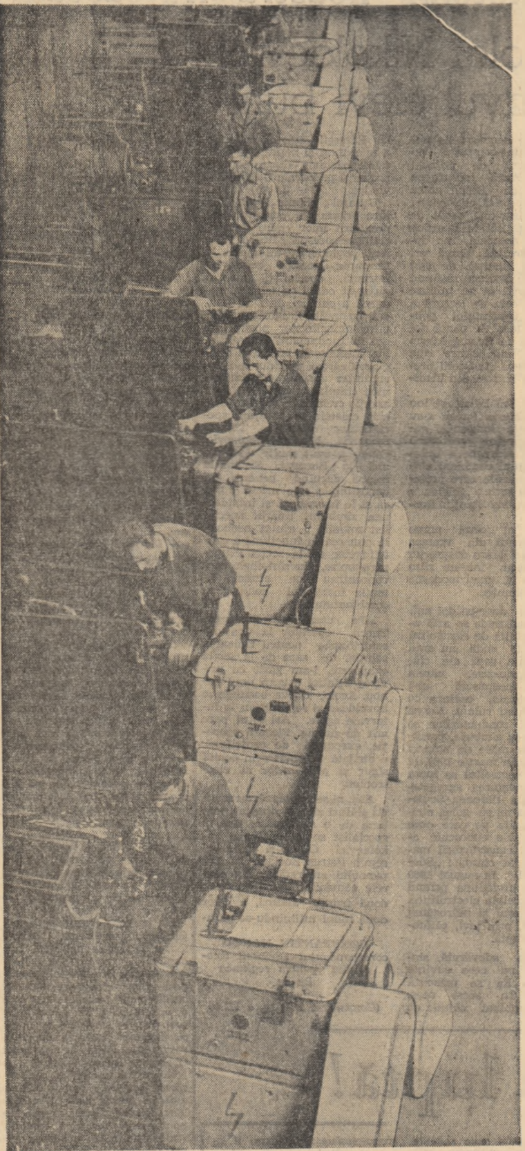
Dispuse într-o aliniere perfectă agregatele și utilajele din secția construcții mecanice a Uzinelor „23 August” dau un aspect plăcut locului de muncă, contribuie la buna desfășurare a procesului de producție