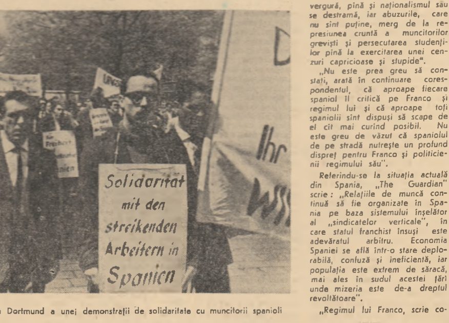
Aspect din timpul desfășurării la Dortmund a unei demonstrații de solidaritate cu muncitorii spanioli