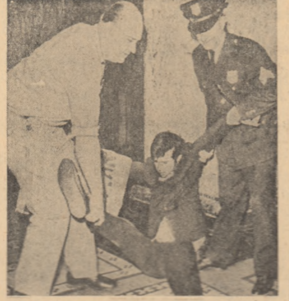
Fotografi din San Francisco se află cu Nikita Hrușciov...