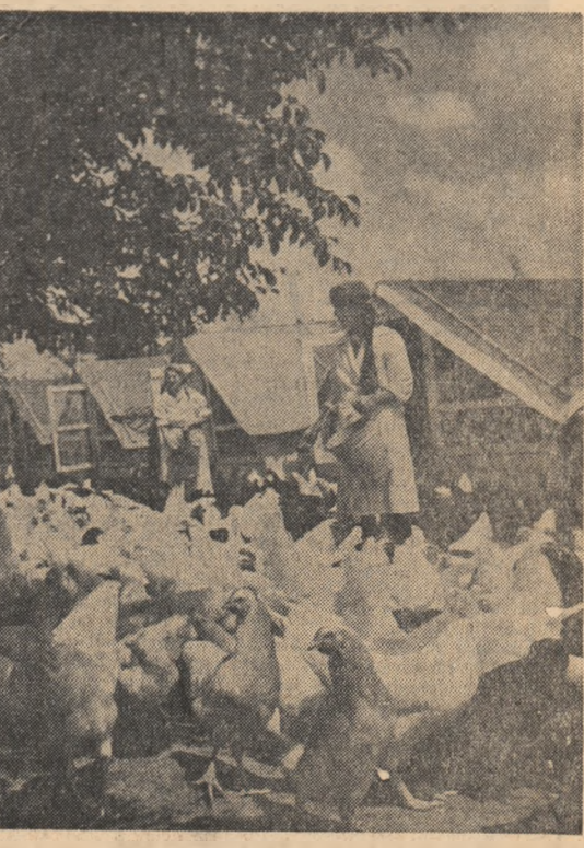
Gospodăria agricolă de stat Tărlățești din regiunea București va crea în anul acesta 120.000 de păsări.