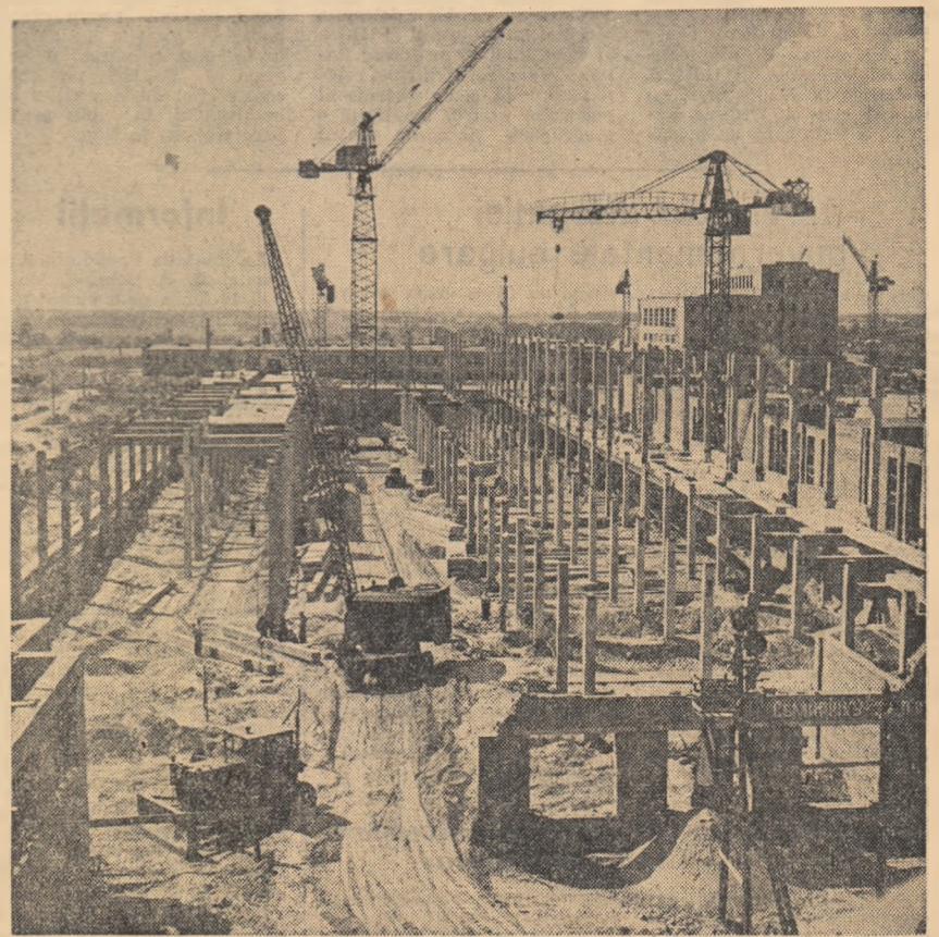
Unul din giganzii industriali care se înalță pe malul Ieniseului, în Siberia