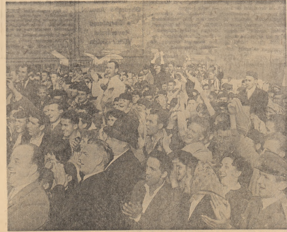
Minerii Văii Jiului au ficut o primire deosebit de entuziastă oaspeților sovietici și conducătorilor de partid și de stat al țării noastre.

Ne exprimăm convingerea că aceste legături vor crește și se vor dezvolta continuu și în viitor spre binele și prosperitatea popoarelor noastre.