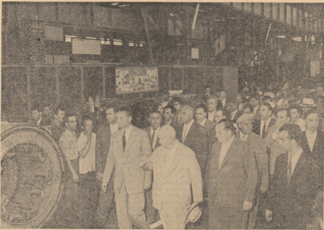
In vizită la Uzinele „Electroputere” din Craiova.

Tribuna este dominată de (Continuare în pag. a III-a)