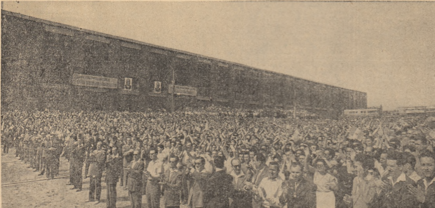
Mii și mii de oameni au aclamat cu însuflețire și dragoste, la mitingul care a avut loc la Craiova, pe membrii delegației sovietice și pe conducătorii de partid și de stat ai țării noastre