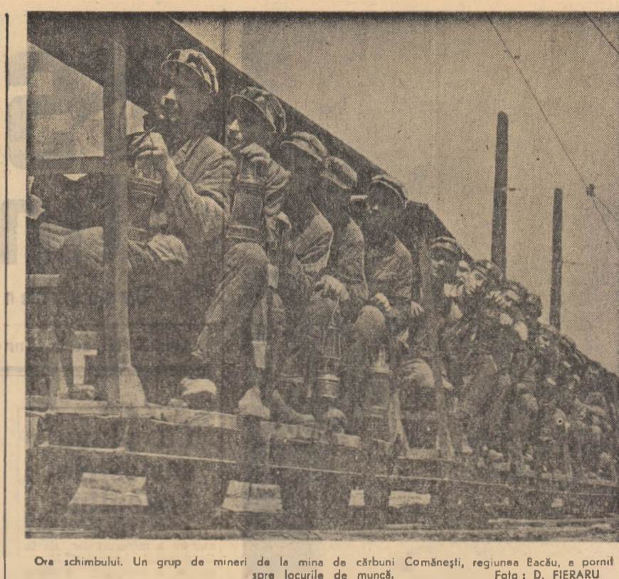
Ora schimbului. Un grup de mineri de la mina de cărbuni Comănești, regiunea Bacău, la pornit spre locurile de muncă.

„Ceea ce îl caracterizează pe acest băiețel, spune lovarșicul diriginte, este că sint foarte uniți, întotdeauna formează un colectiv puternic și noi care avem emoții în acest examen de maturitate credem că și de data aceasta se vor prezenta la noi”.