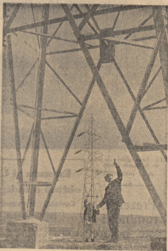
Pe meleaguri moldovene.