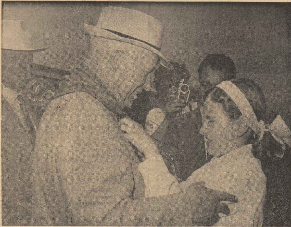
La sosirea în gara Constanța