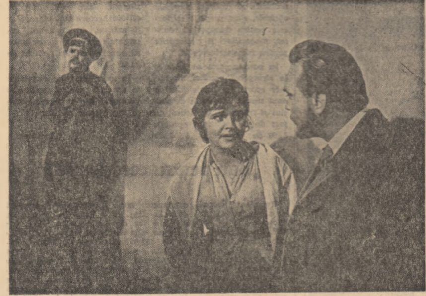
O scenă din film.