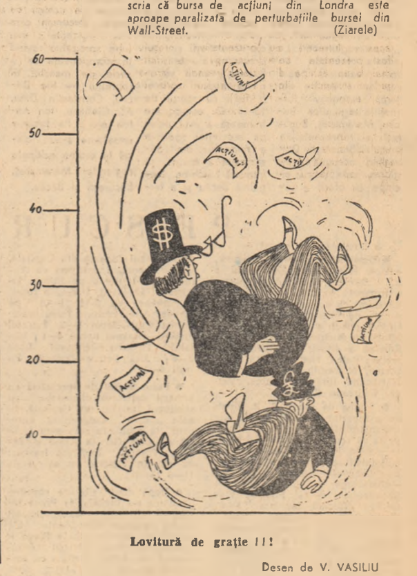
Lovitură de grație!!! Desen de V. VASILIU

ALGER. Corespondentul agenției Reuter scrie că teroarea deziluziunii în Oran (Algeria de vest) de „Organizația armată secretă” continuă. Pentru a treia oară în două zile, arată corespondentul, O.A.S.-iștii au incendiat primăria din Oran. O parte din clădire a fost mistuită de flăcări.