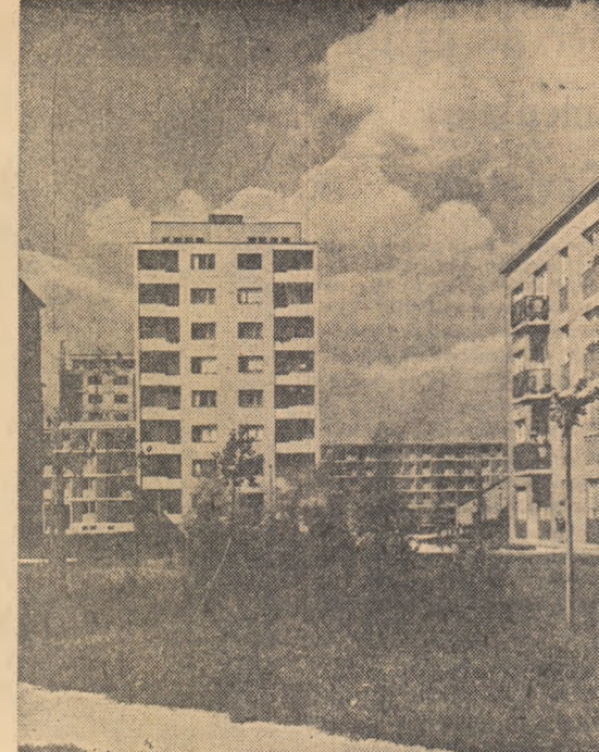
Noi blocuri de locuințe recent date în folosința oamenilor muncii la Budapesta.

MOSCOVA 25 (Agerpres). — TASS transmite: La 25 iunie, delegația de partid și guvernamentale a U.R.S.S., în frunte cu N. S. Hrușciiov, prim-secretar al Comitetului Central al Partidului Comunist al Uniunii Sovietice, președintele Consiliului de Miniștri al U.R.S.S., a sosit la Moscova, venind de la București. Pe aeroportul Seremetievo, pavoază cu drapelul de stat ale Uniunii Sovietice, au venit un mare număr de reprezentanți ai oamenilor muncii din Moscova.