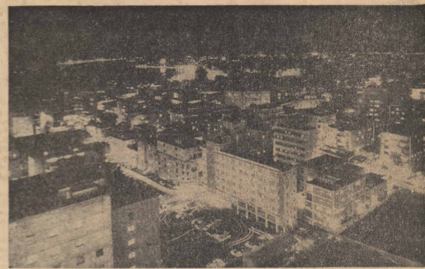
Havana, capitala Cubei, este un oraș renumit prin frumusețea sale. În fotografie: Vedere panoramică a Havanei în timpul nopții.

Documentele adoptate de Adunarea „O lume fără bombe” sînt pînă la urmă de preocuparea sinceră pentru securitatea populațiilor și înlăturarea pericolului unui război nuclear.