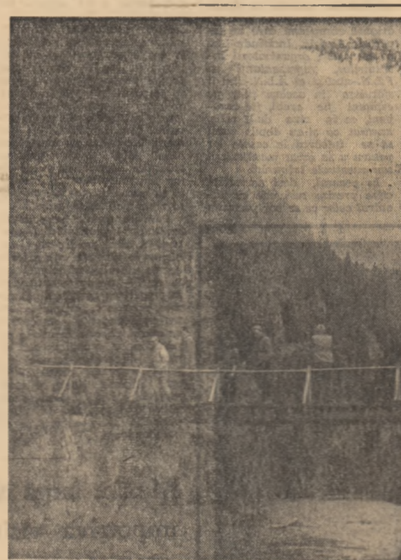
Peisaj pe valea Ialomicioarei, la Bolboci

Președintele Consiliului de Miniștri al R. P. Romine, Ion Gheorghe Maurer, a primit vineri 29 iunie 1962 pe directorul general al Organizației pentru alimentație și agricultură a Organizației Națiunilor Unite, Dr. B. R. Sen. A fost de față ministrul afacerilor externe al R.P.R., Corneliu Mănescu.