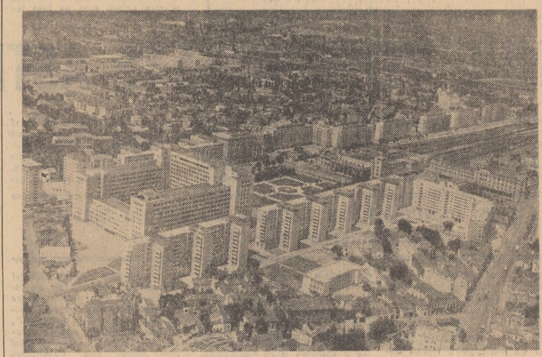
Vedere din Capitală. Noile blocuri de lângă Gara de Nord.

pus la dispoziția muncitorilor, tehnicienilor și inginerilor. Avînd astfel la îndemînă un bogat material documentar I. BODEA E. FLORESCU I. TEOHARIDE (Continuare în pag. a III-a)