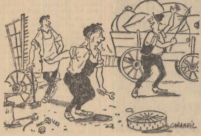
FIERARUL: — Gata, la secerători am terminat cu reparatul... COLECTIVISTUL: — Am terminat și noi cu seceratul.

Motto: La gospodăria colectivă din Radomirești din cele peste 50 de secerători simpli doar 25 au fost reparate bine și la timp, intrînd în campanie. În zilele cînd secerișul era pe isprăvite, țerarii încă mai dădeau zor cu reparatul a 4 secerători simpli.