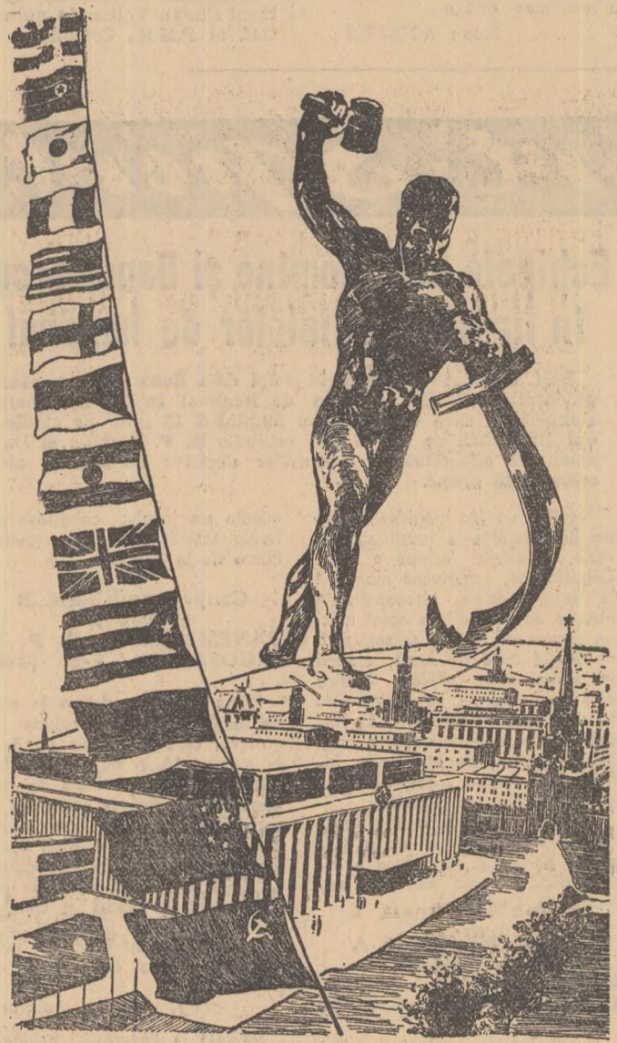
Desen de M. Kuznefov din „Komsomolskaia Pravda”

În fotografie: vedere din Bagdad, capitala Republicii Irak.