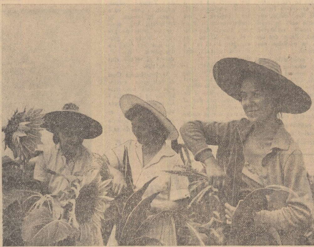
Tinere studente de la Institutul pedagogic din București aduc un ajutor prețios lucrărilor ce se desfășoară acum pe ogarele gospodăriei de stat Asanaga

ILIE BASARABĂ secția mecanică, atelierul freze, Uzina „Independența”-Sibiu