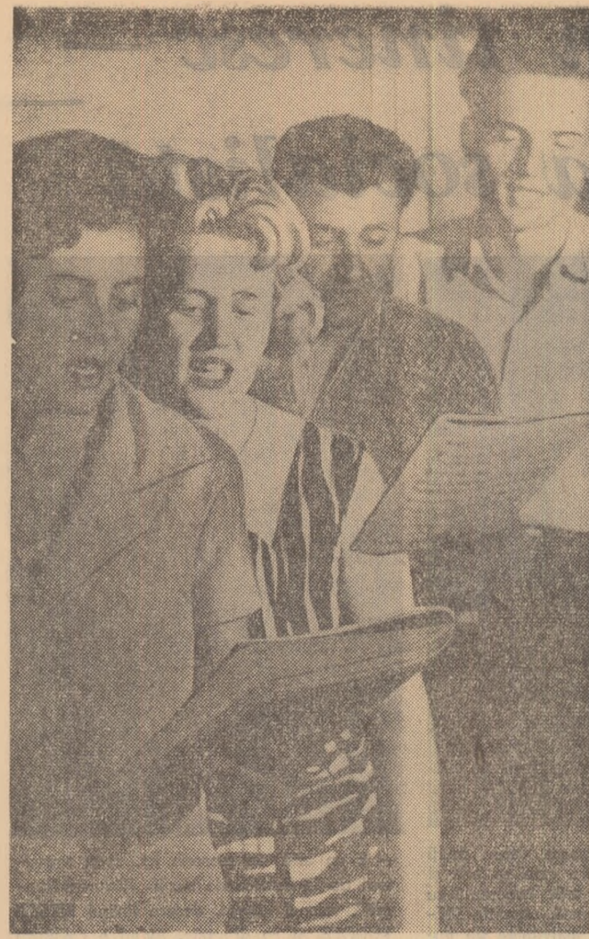
În orele libere, la club, tinerii muncitori de la Fabrica de tricotate „Drapelul roșu”-Sibiu înveță noi cînteca.