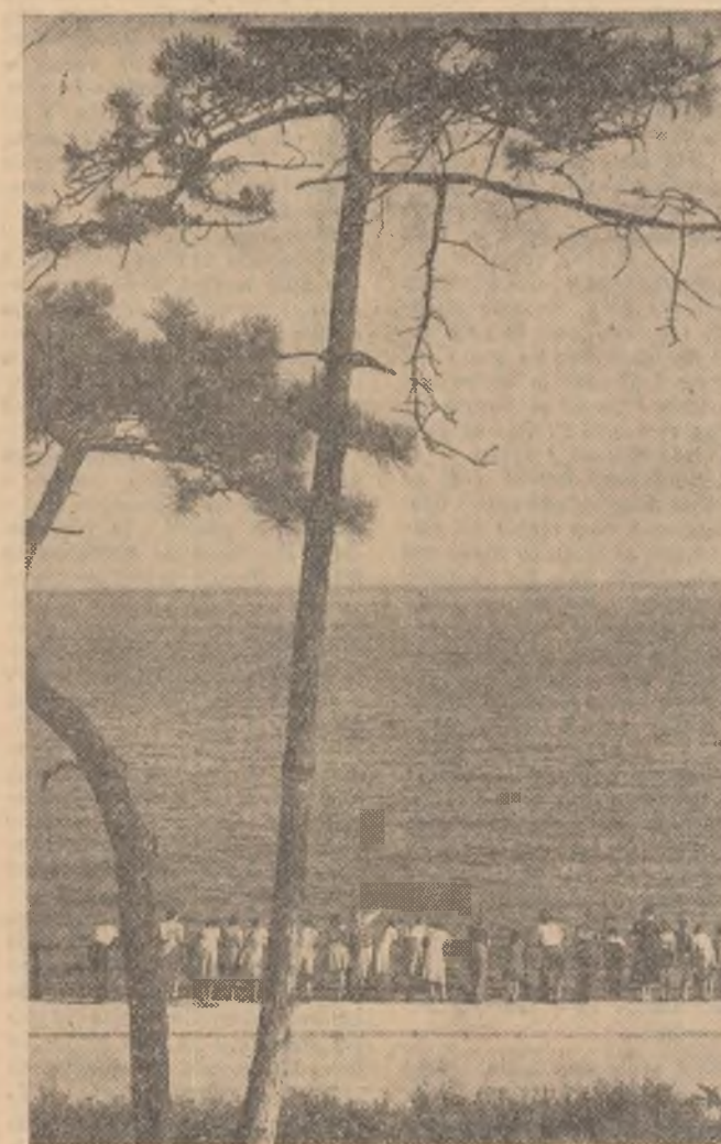
Constanța, Pe faleză