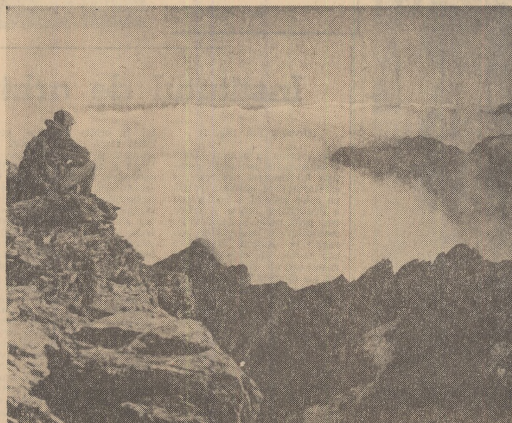
În munții Făgăraș.

Atît formațiile de fanfără, mandoline și dansuri, cit și soliștii acompaniați de taraful cunoscut iubitorilor de muzică, au contribuit din plin la odihna și distracția oamenilor muncii prezenți. Formațiile s-au distins printr-o bună coordonare orchestrală și printr-un reperoriu bogat și variat. Meri-