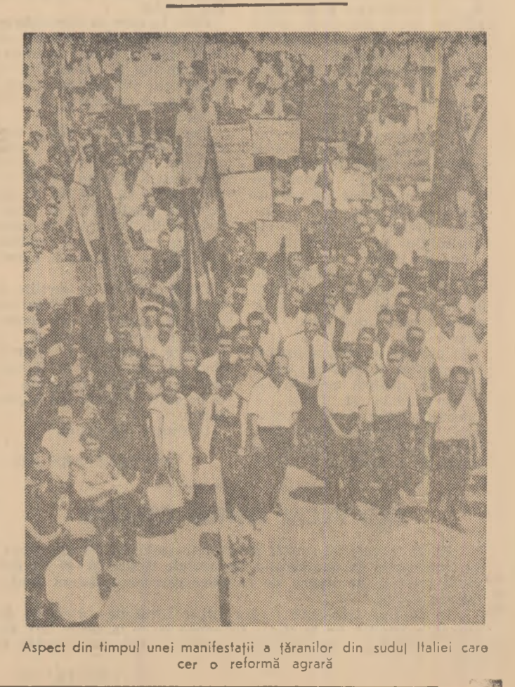
Aspect din timpul unei manifestații a țărănilor din sudul Italiei care cer o reformă agrară

serioase infirmități ca urmare a accidentelor de muncă, cauzate de lipsa totală de protecție a muncii. O bună parte din muncitorii accidentați devin apoi de muncă pentru toată viața. „Ei sînt, conchide ziarul, ca o lămie stoarsă de ultima picătură de zeamă, și se află într-o situație disperată”.