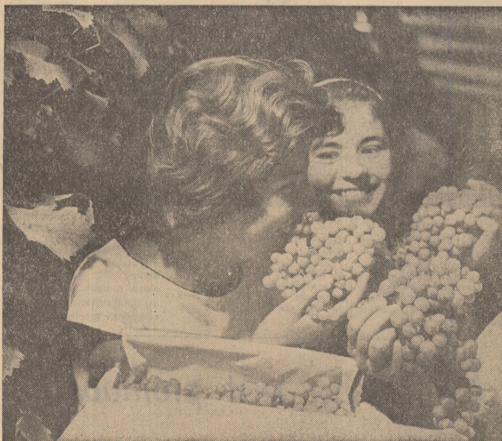
La culosul strugurilor. Nu, nu-i o imagine de anul trecut. La serele stațiunii experimentale viticole de la Greaca, regiunea București, se strînge prima recoltă de struguri

Sîșteau sus, pe „movila cu dragoste” trei oameni din două generații. Și era o astfel de armonie între ei, cum în alte vremuri n-a fost niciodată.