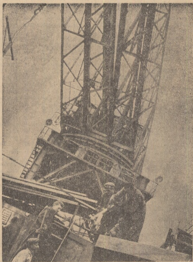
Se lucrează la o nouă navă la Șantierul naval Galați

J. SAMBU Președintele Prezidiului Marelui Hural Popular al R. P. Mongole