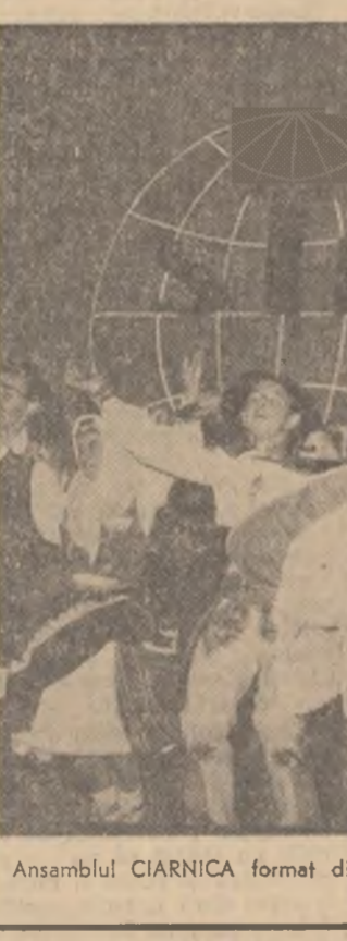
Ansamblul CIARNICA format din membri ai Uniunii Tineretului Cehoslovac din Kosice la o repetiție în vederea Festivalului

Salutul adresat de Suvanna Fumma Festivalului