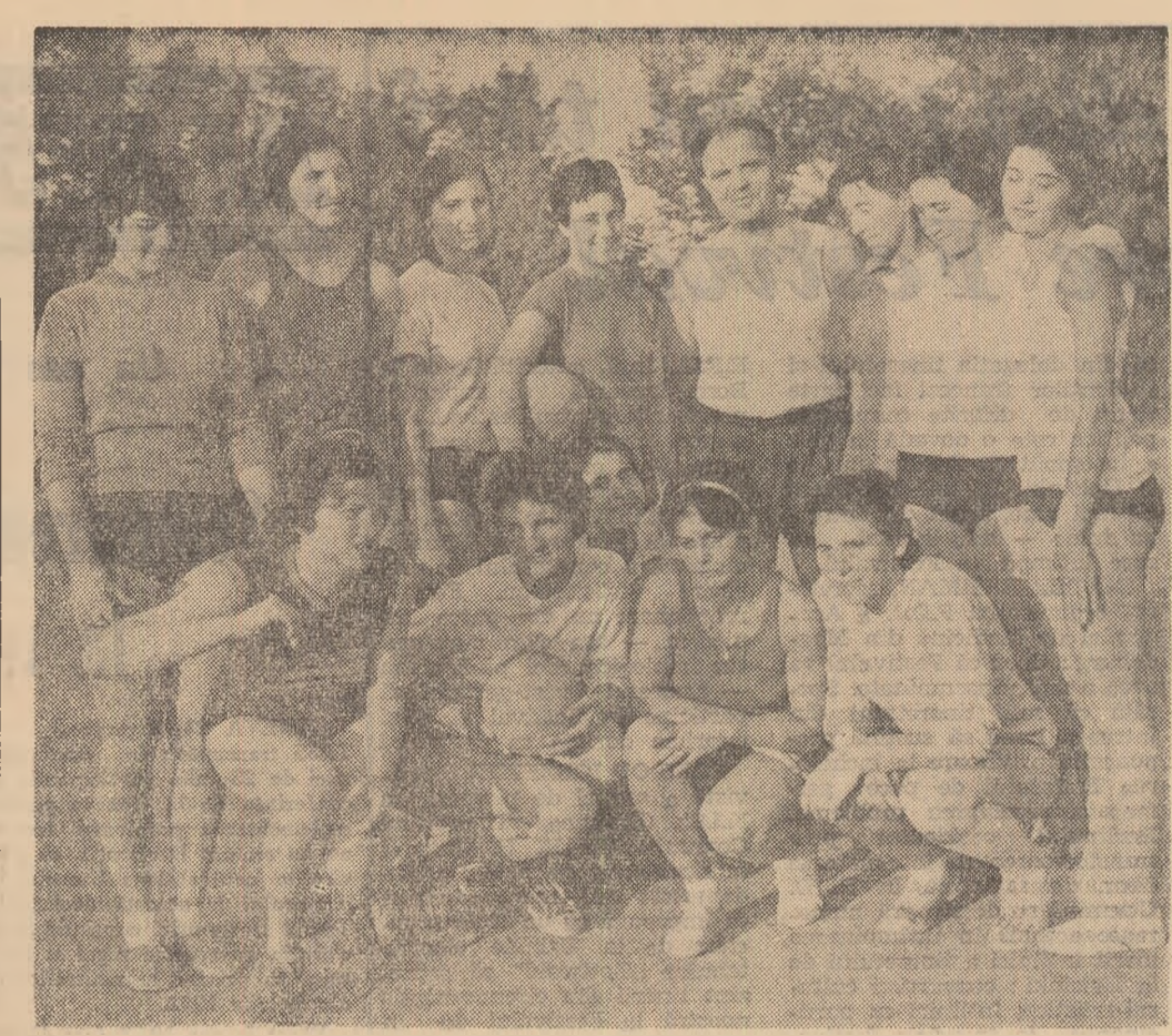
Vă prezentăm lotul de volei feminin care va participa la Festivalul de la Helsinki.