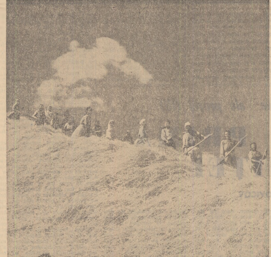
Imensa șiră de paie crește văzînd cu ochii. Și acesta este un indiciu că la aria colectivităților din comuna Pucștii de Jos, raionul Rimnicu Sărat se lucrează din plin.

PITEȘTI (de la corespondentul nostru). Raionul Slătina este printre primele raioane din regiunea Argeș care au terminat secerișul. Într-un termen scurt, colectivității din acest raion au reușit să recolteze păioasele de pe întreaga suprafață de aproape 34 000 de hectare. La treierii însă, munca nu se desfășoară în același ritm ca la seceriș. Pînă acum s-a treierat grîul de pe o suprafață de 15 900 ha. Și aceasta mai mult cu ajutorul combinelor. În unele comune ca Valca Mare, Timpeni, Potocava și Negreni, care au cantități mari de treierat nu sint folosite toate atelele pentru transportul grăului de pe cîmp la ari, iar batozete nu lucrează din plin. În ceea ce privește arăturile adînci de vară și însămînțatul culturilor duble, situația este, de asemenea, nesatisfăcătoare. Ploaia care a căzut în ultimul timp a creat condiții favorabile efectuării acestor lucrări. În G.A.C. Ci-reșov colectivității au reușit să însămînțeze pînă acum toată suprafața de 50 ha planificate pentru porumb. Prin-tr-o mai bună organizare a muncii se poate reduce mult decalajul dintre seceriș și arături și se poate urgenta însămînțatul culturilor furajere.