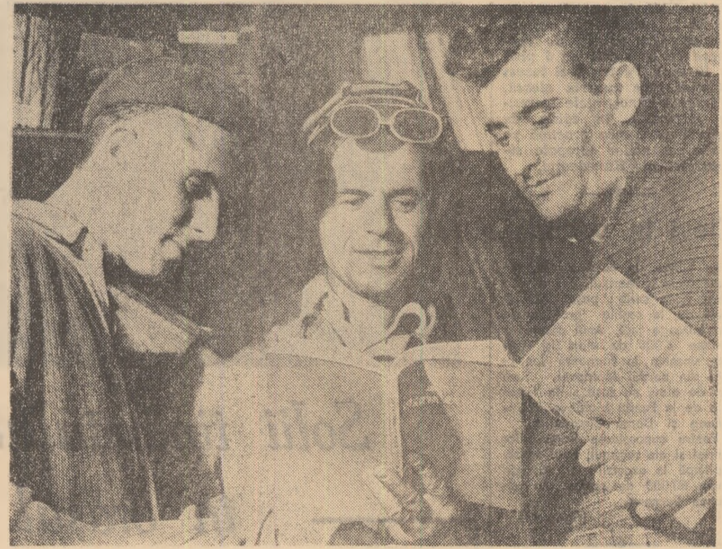
Un prieten nedespărțit al oțelărilor de la Hunedoara — certea.