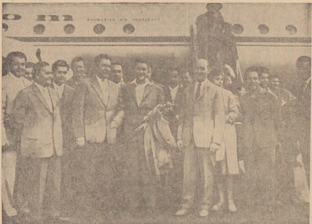
Delegația tineretului din R. P. Română pe aeroportul din Helsinki.

În declarația Comitetului gree de pregătire pentru festival, dată publicității la 27