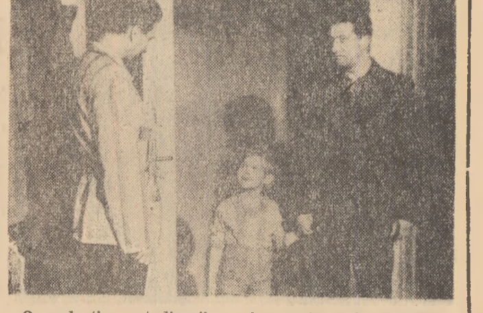
O producție a studiourilor poloneze, în regia lui Jerzy Passendorfer. Impresionantă dramă a unui copil. În completarea: Documentarul romînesc de scurt metraj „HIRTIA SE NAȘTE DIN APE”.