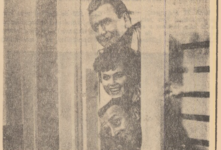
O producție a studiourilor „Defa”-Berlin. O inspirată comedie muzicală. Umor fin, muzică de bună calitate.