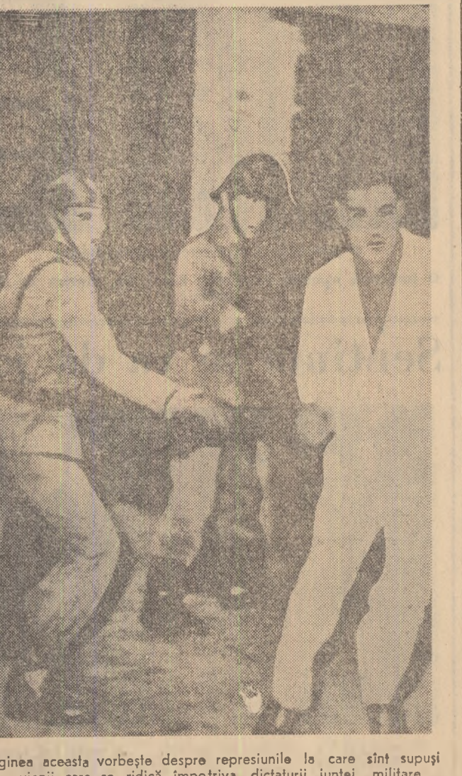
Imaginaea aceasta vorbește despre reprimiunile care sînt supuși peruvienii care se ridică împotriva dictaturii juniei militare.

Încheiere, O. Winzer a subliniat necesitatea imperioasă ca în interesul asigurării păcii să se pună capăt provocărilor din Berlinul occidental împotriva R.D.G. și să se încheie tratatul de pace german și să se normaliza situația în Berlinul occidental.