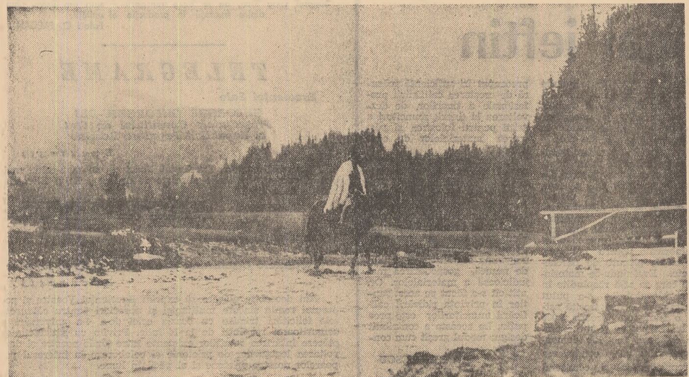
Dimineața în Bucegi pe Valea Ialomicioarei