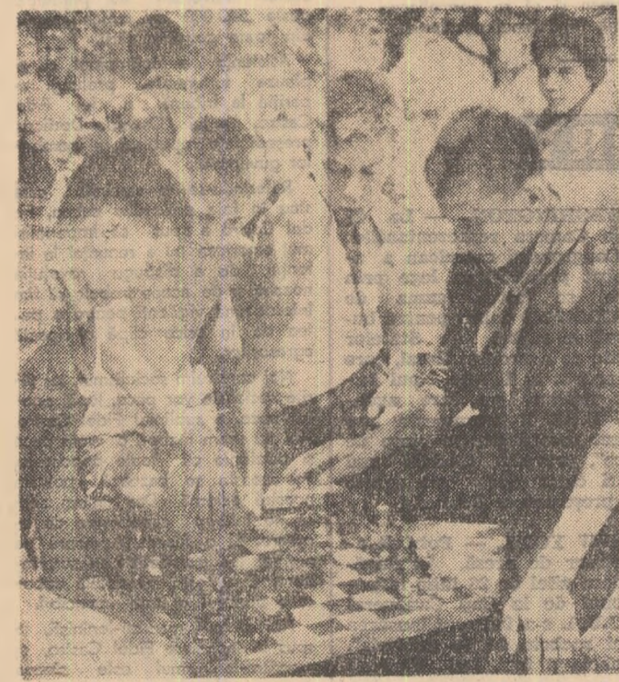
Șahul nău de loc un sport de sezon. Iată de ce și aici, în tabăra de pionieri de la Tuzla, jocul de șah și-a adunat prietenii într-o dispută.