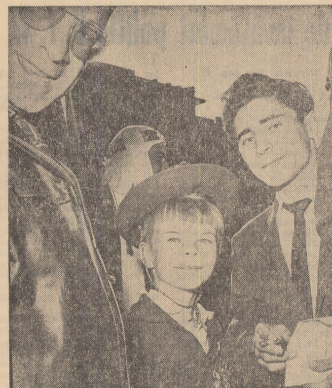
Micutul finlandez suride fericit. Și-a făcut noi prieteni, și-a mai adăugat pe piept încă o insignă.