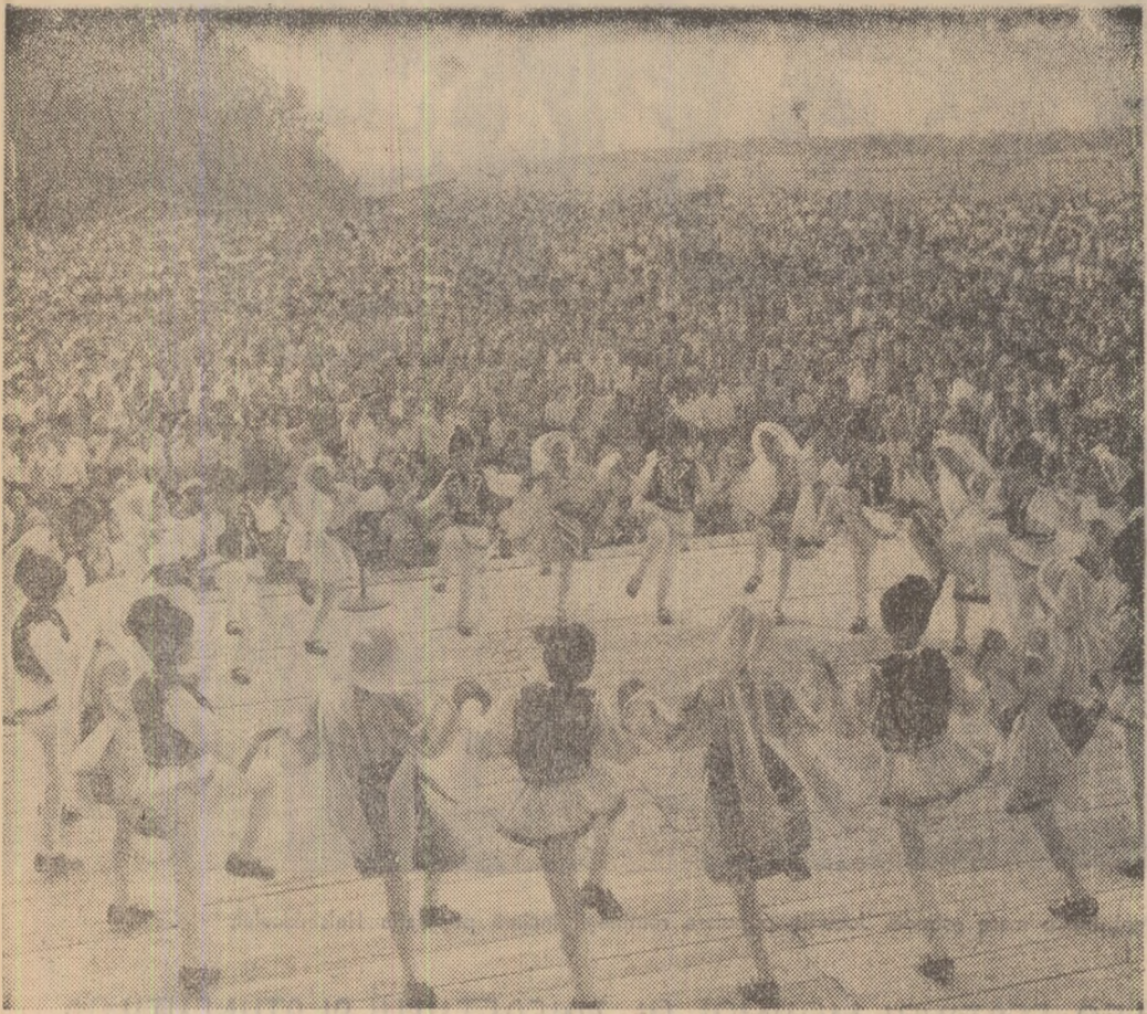
O duminică de odihnă colectivă la Cervenia, raionul Zimnicea.