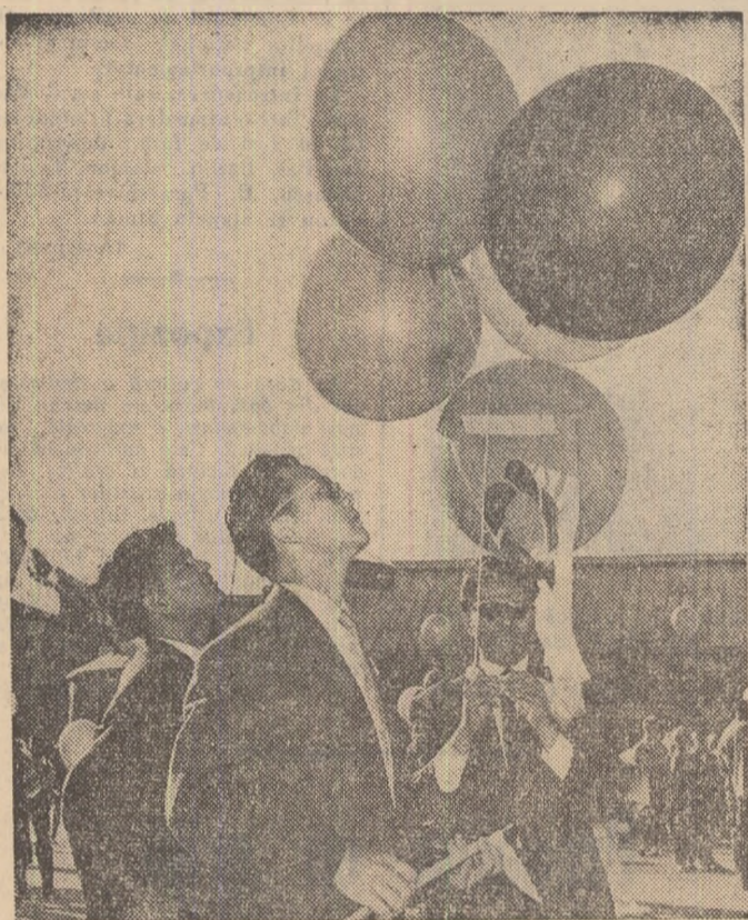
Au venit din continente diferite — Pe una din străzile Helsinki-ului cițiva tineri înaltă baloane cu embleme Festivalului.