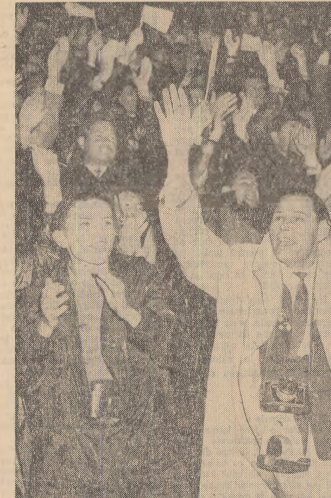
Plăcia n-a temperat entuziasmul. Tinerii din zeci de țări aclamă ideile nobile de pace și prietenie.