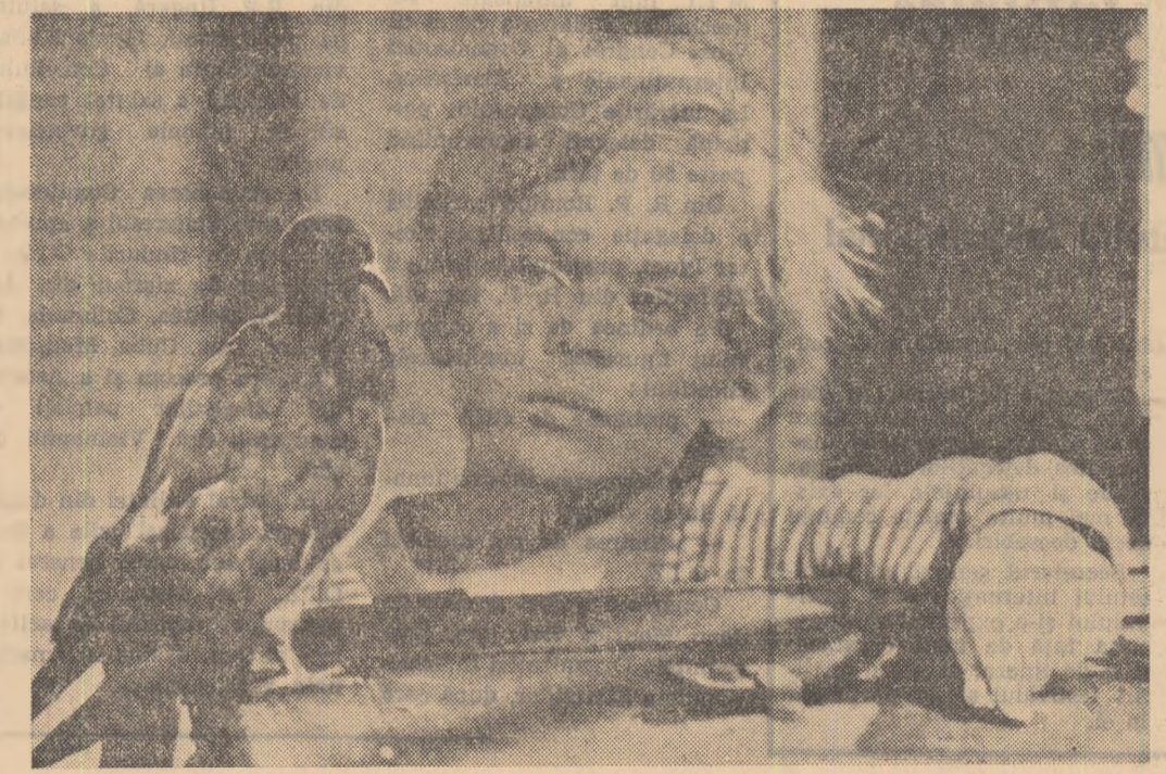
Cadru din filmul „Sentința se va da joi”