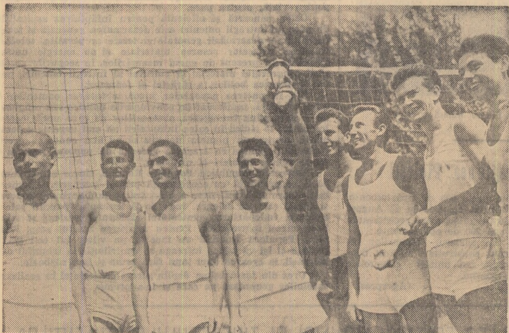
Vă prezentăm echipa întreprinderii „Electronica” câștigătoare la volei în cadrul etapei finale pe Capitală a Spartachiadei de vară a tineretului.

În zilele și zecile de mai de tineri care au participat anul acesta în Capitală la Spartachiada de vară a tineretului — competiție tradițională care se bucură de o mare atenție în rândurile celor care fac primii pași în sport — cei care s-au dovedit cei mai buni pregătiți de-a lungul etapelor precedente și-au disputat simbolică și duminică titlurile de câștigători în întrecerea finală.