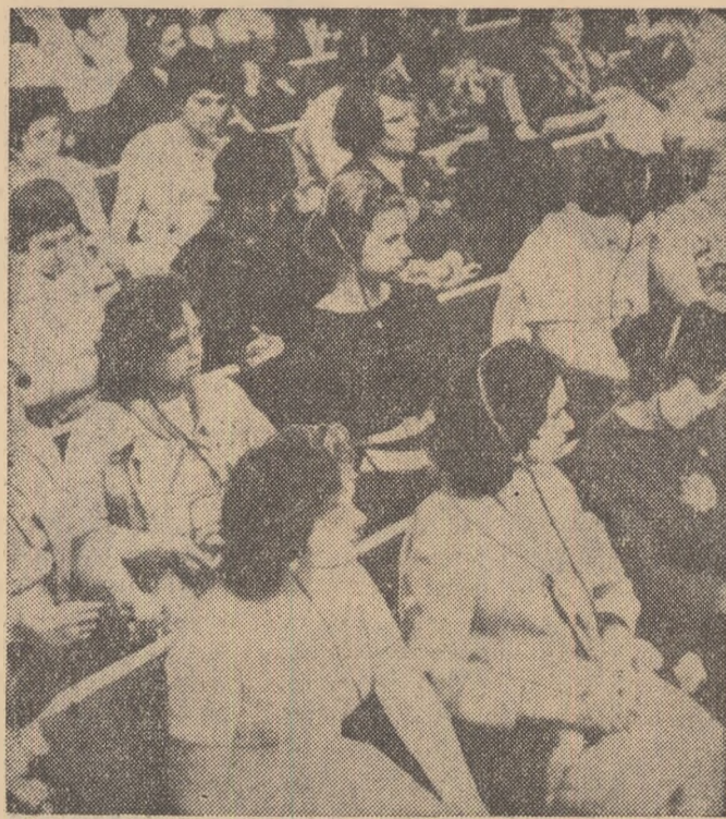
Aspect de la înfîlțirea tinerelor fele.