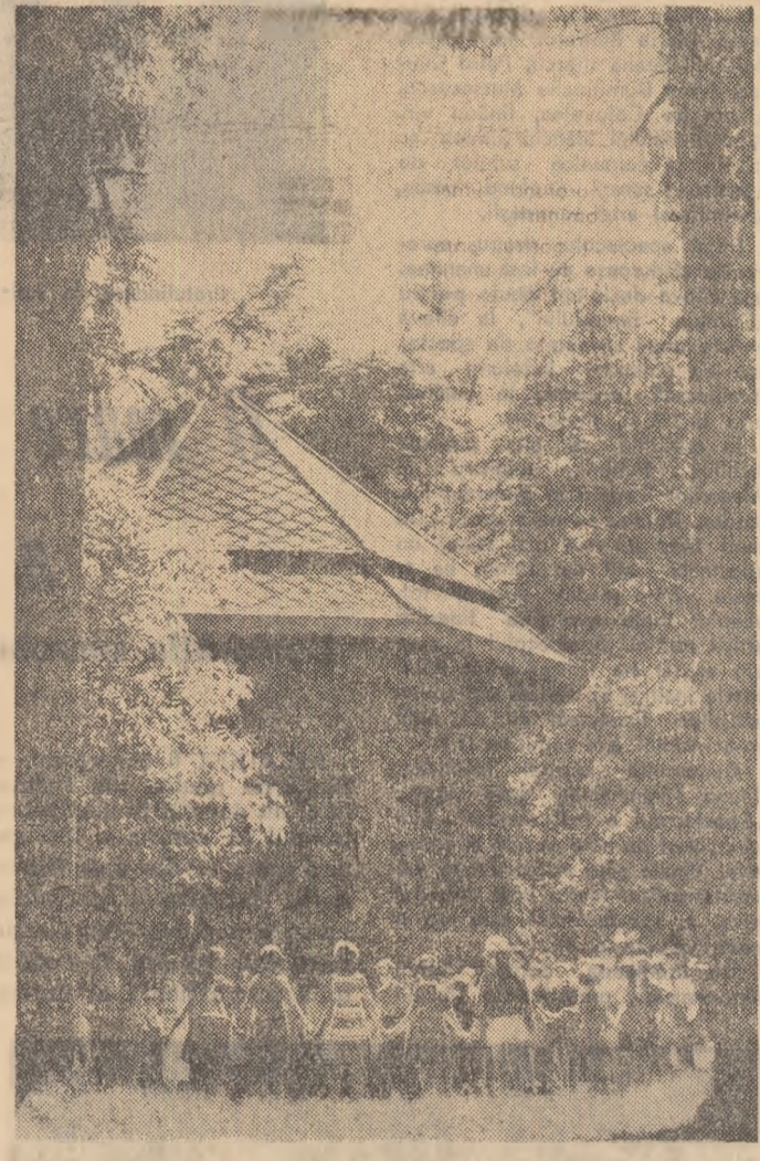
Parcul Ostrov din Călimănești răsună de vioiașea elevilor care-și petrec vacanța în frumoasa stațiune.

cu o prezentare echivocă a unei alți de importante probleme de etică? Nu — în ciuda aparențelor. Creatorii filmului rostesc de fapt sentința în procesul dezbătut pe ecran, printr-un amănunt de o deosebită expresivitate. În timp ce mama se roagă, cu glasul înăbușit de hohotele de plîns, „nu-mi lăsați copilul, sînt sîngur pe lume, numai pe el îl am” etc., etc. — Adam, în sala de așteptare privind pe amant, vede pe amantul mamei sale — despre care ea declarase că a părăsit-o fugind cu banii — bind liniștit obișnuitele sticle cu bere, așteptînd vizavi de tribunal să-și reia din nou locul, părăsit „strategie” pentru citiva zile. Mai poate fi în acest caz vorba de dreptul mamei de a-și păstra copilul, pe care-l va maltrata în continuare, crescîndu-l într-o atmosferă de desfrîu și totală descompunere morală? Este evident că nu. Originalitatea modului de prezentare a cazului pînă în discuțiile de cineștii polonezi constă în orientarea atenției nu spre încheie-