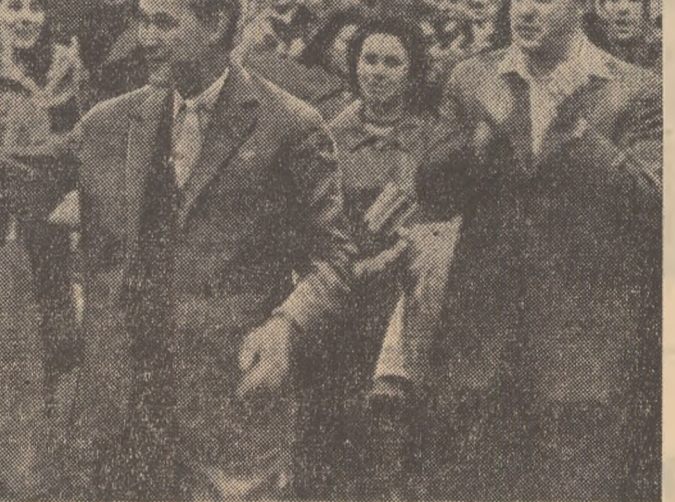
Solii tineretului nostru înlîmpinați cu căldură la înlîmpinarea cu membrii delegației sovietice. Teletolo 1, TASS

au și drapelul Republicii Populare Romîne. Pe tot parcursul miile de tineri și tinere scîndu în zeci de limbi lozinci festivalului — „pace și prietenie”. Locuitorii din Helsinki, masași pe trotuare, se alăturau acestei lozinci, manifestîndu-și sentimentele de prietenie față de solii tineretului lumii.