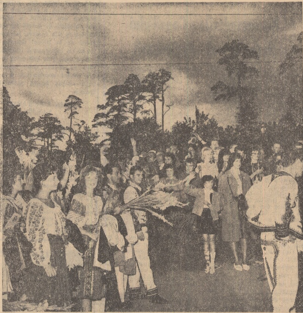
Prelundeni, la Helsinki, tinerii romini au fost înconjurați cu dragoste și simpatie.