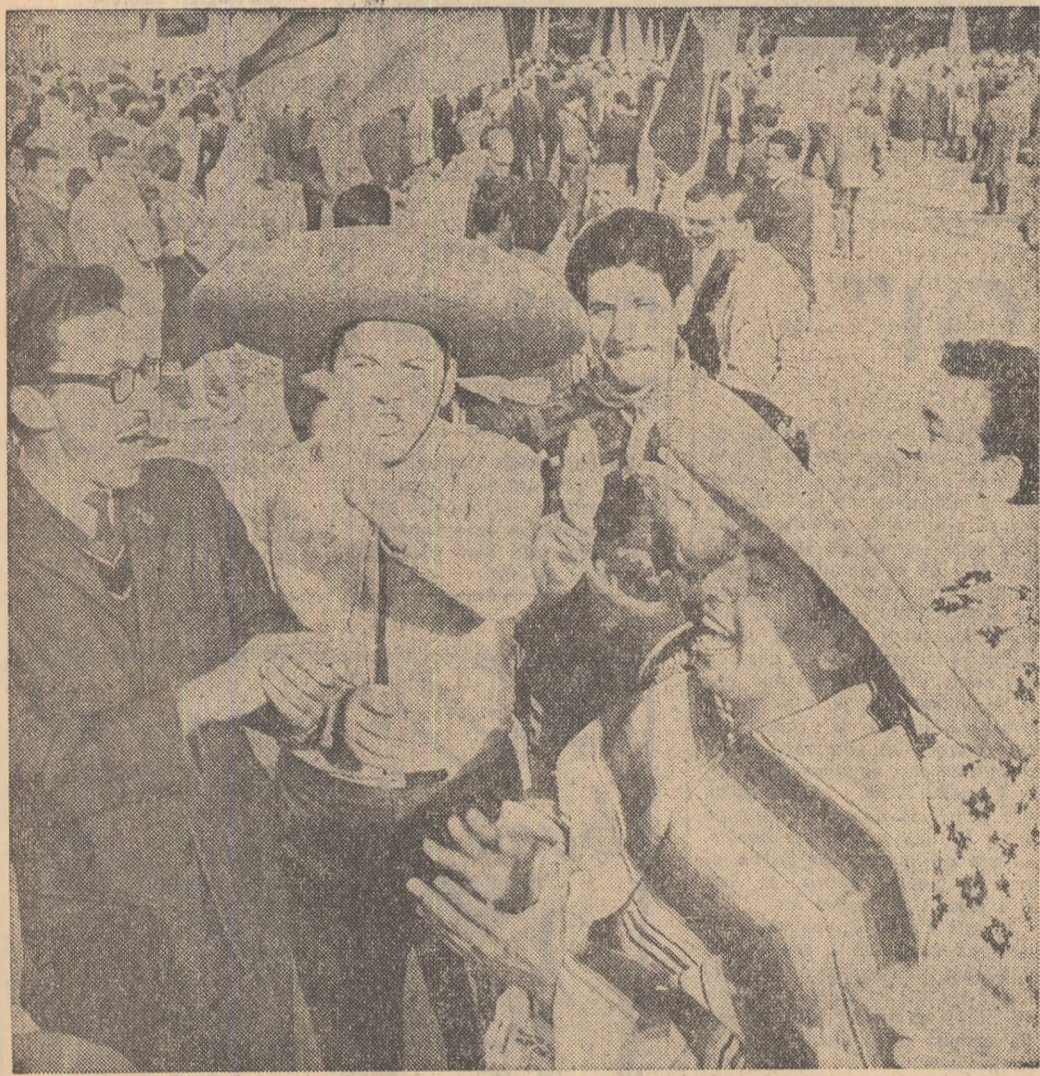
Un grup de tineri din America Latină.