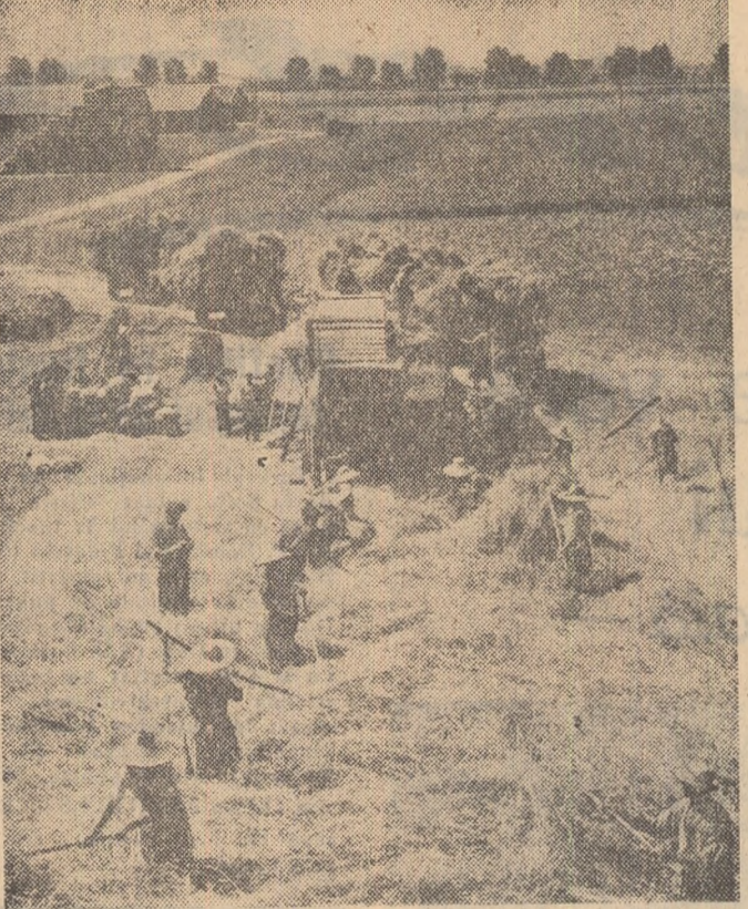
Colectivii din Ghimbav — Brașov freieră cu spor.