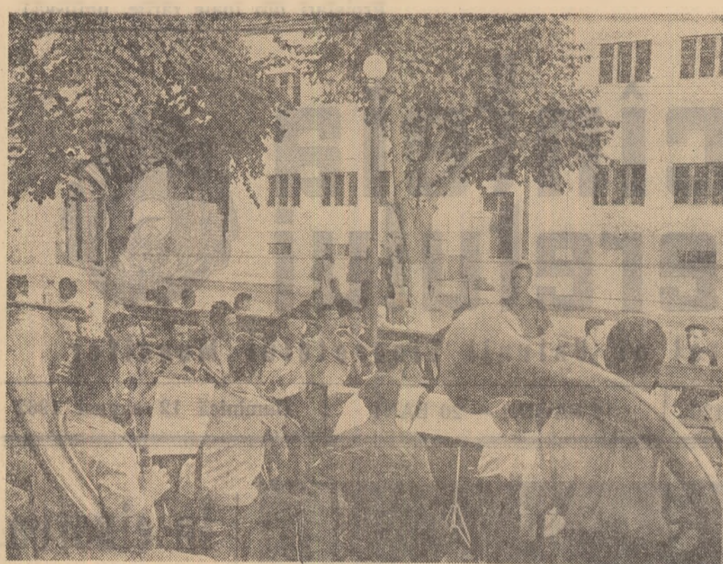
Fanera minerilor din Baia Sprie, regiunea Meramureș pregătindu-și programul cultural de Ziua Minerului.

(Folclor cules din reg. Hunedoara de ANA ȘOIT și prof. ION ILIESCU). Seleționat și comentat de ION MEIȚOIU