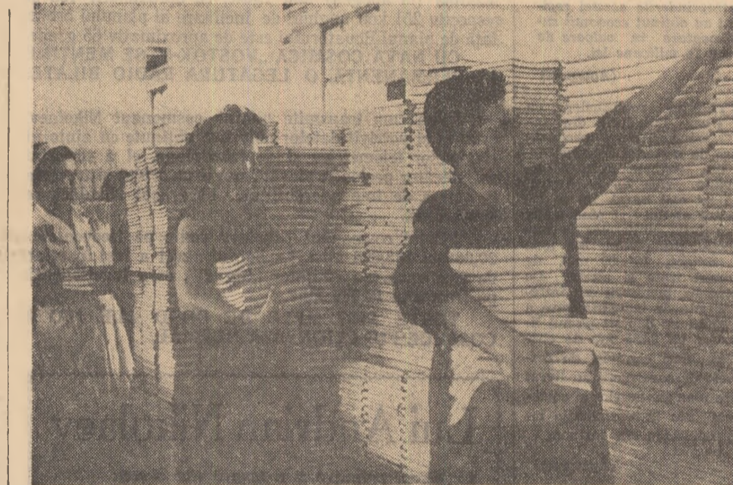
În secție legătoria a Combinatului poligrafic „Casa Școlare” un nou lot de manuale vor lua drumul librărilor.

Printre cele mai importante inovații aplicate în ultima