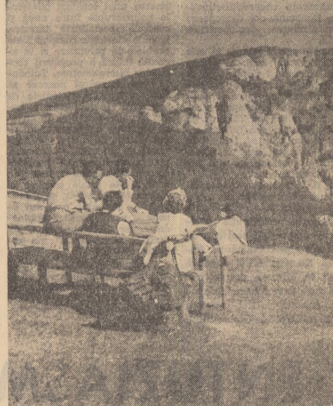
În Munții Ceahlău.

La a XV-a sesiune a Adunării Generale a O.N.U., guvernul