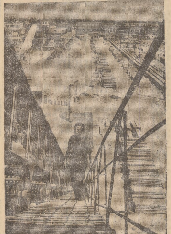
Întreprinderea de prefabricate „Progresul” din Capitală. Banda de transportare a materiei prime spre secția de fabricare asigură desfășurarea în bune condiții a procesului de producție.