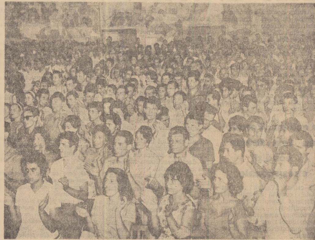
Aspect din timpul adunării de la Casa de cultură a tineretului din raionul Tudor Vladimirescu