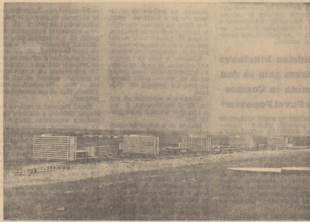
Noul construcții la Mamaia (vedere din avion).