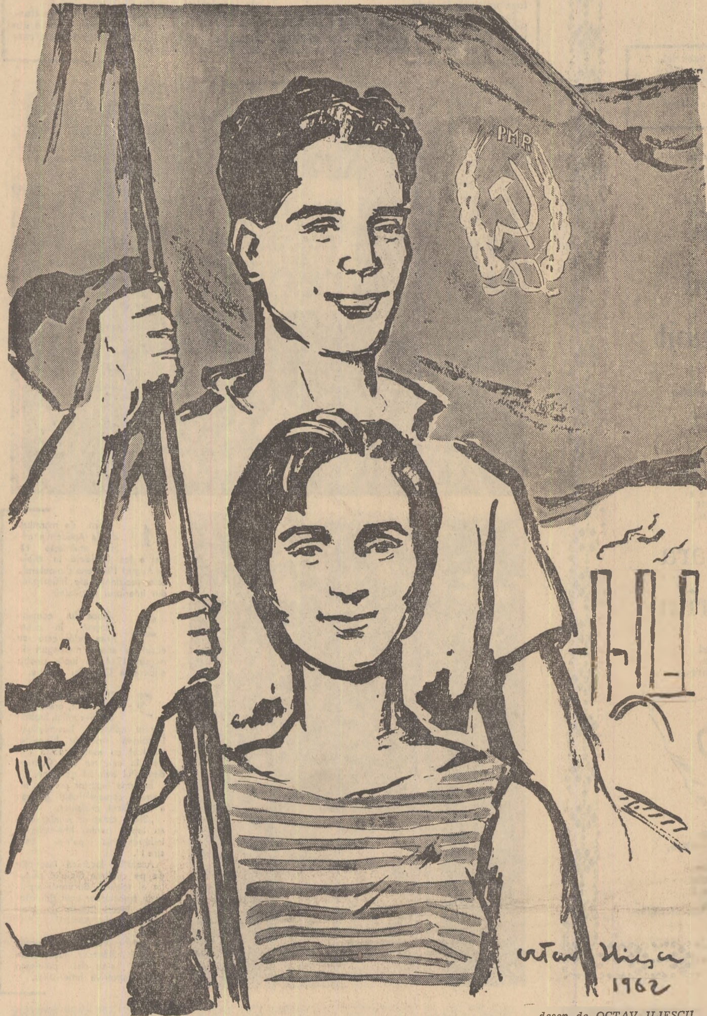
desen de OCTAV ILIESCU 1962