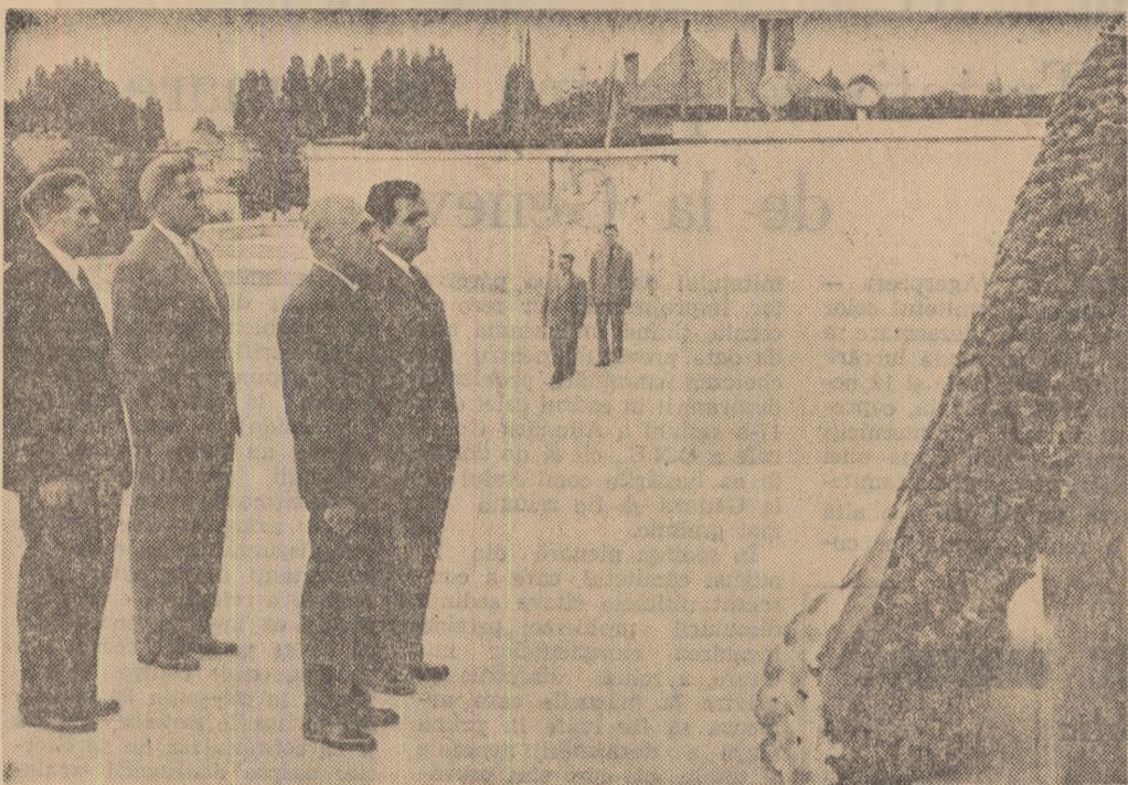
La Monumentul Eroilor Patriei.