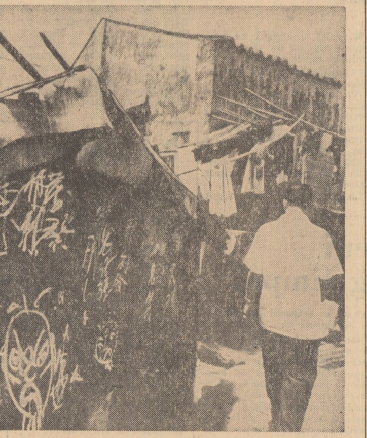
În asemenea cocioabe improvizate din bucăți de tablă sînt nevoiți să trăiască zeci de mii de oameni și muncii din colonia britanică Hong Kong.