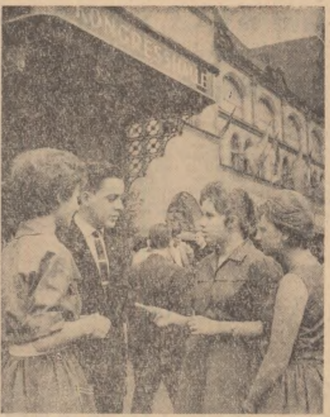
Tineri muncitori din R. D. Germană și din Germania occidentală discutând într-o pauză al celui de-al V-lea Congres al tinerilor muncitori care s-a ținut la Leipzig.

Ziarele japoneze au publicat fotografiile cu aspecte de la expoziție, iar televiziunea din Tokio a prezentat în cadrul programului imaginii de la deschidere.