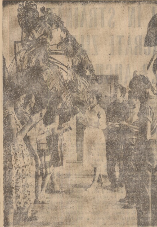
Candidații care se vor prezenta la examenul de admitere își însoțesc cunoștințele în cadrul cursurilor de pregătire organizate la fiecare institut și facultate. În fotografie un aspect de la cursul de pregătire a candidaților la Institutul Agronomic „Ion Ionescu de la Brad” din Iași.