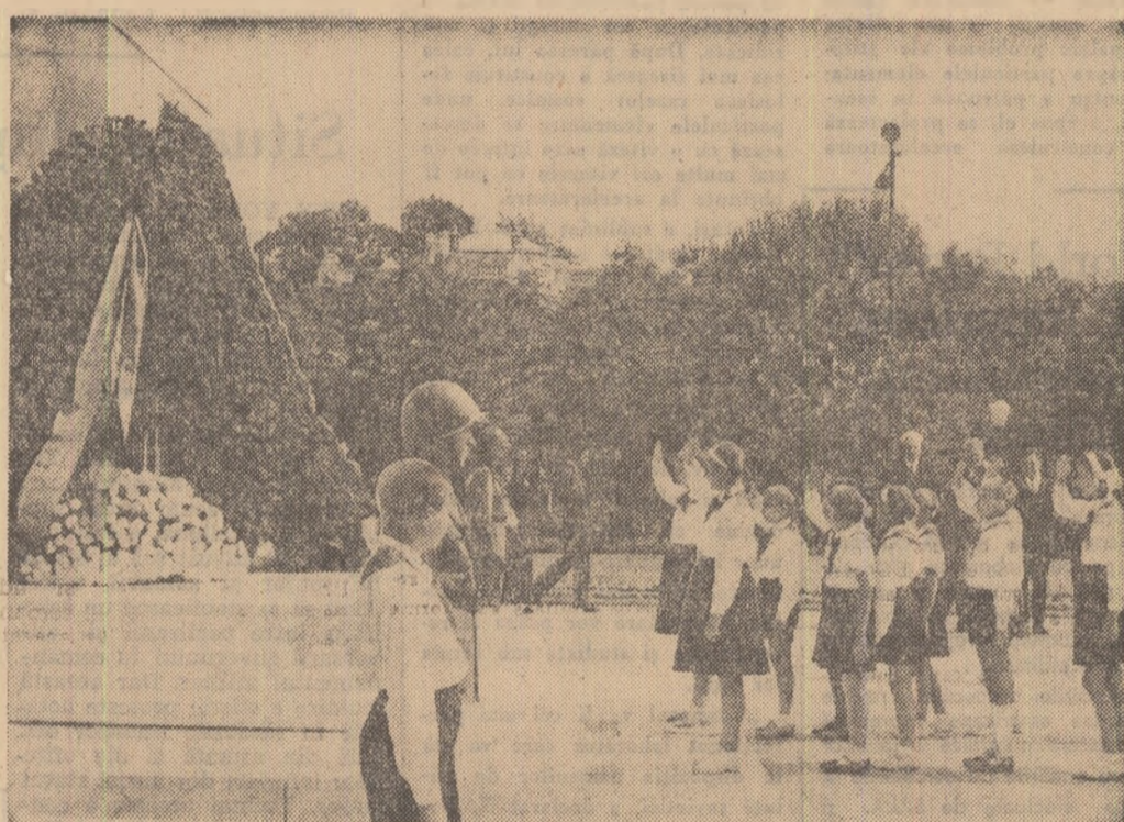
La Monumentul Eroilor Sovietici

Au fost depuse coroane de flori din partea C.C. al P.M.R., Consiliului de Stat și Consiliului de Miniștri, Consiliului Central al Sindicatelor, C.C. al U.T.M. și Consiliului U.A.S.R., Ministerului Forțelor Armate, Consiliului general A.R.L.U.S., Comitetului orașenesc București al P.M.R. și Sfatului Popular al Capitalei, din partea unor mari întreprinderi. Pionierii au depus jerbe de flori.