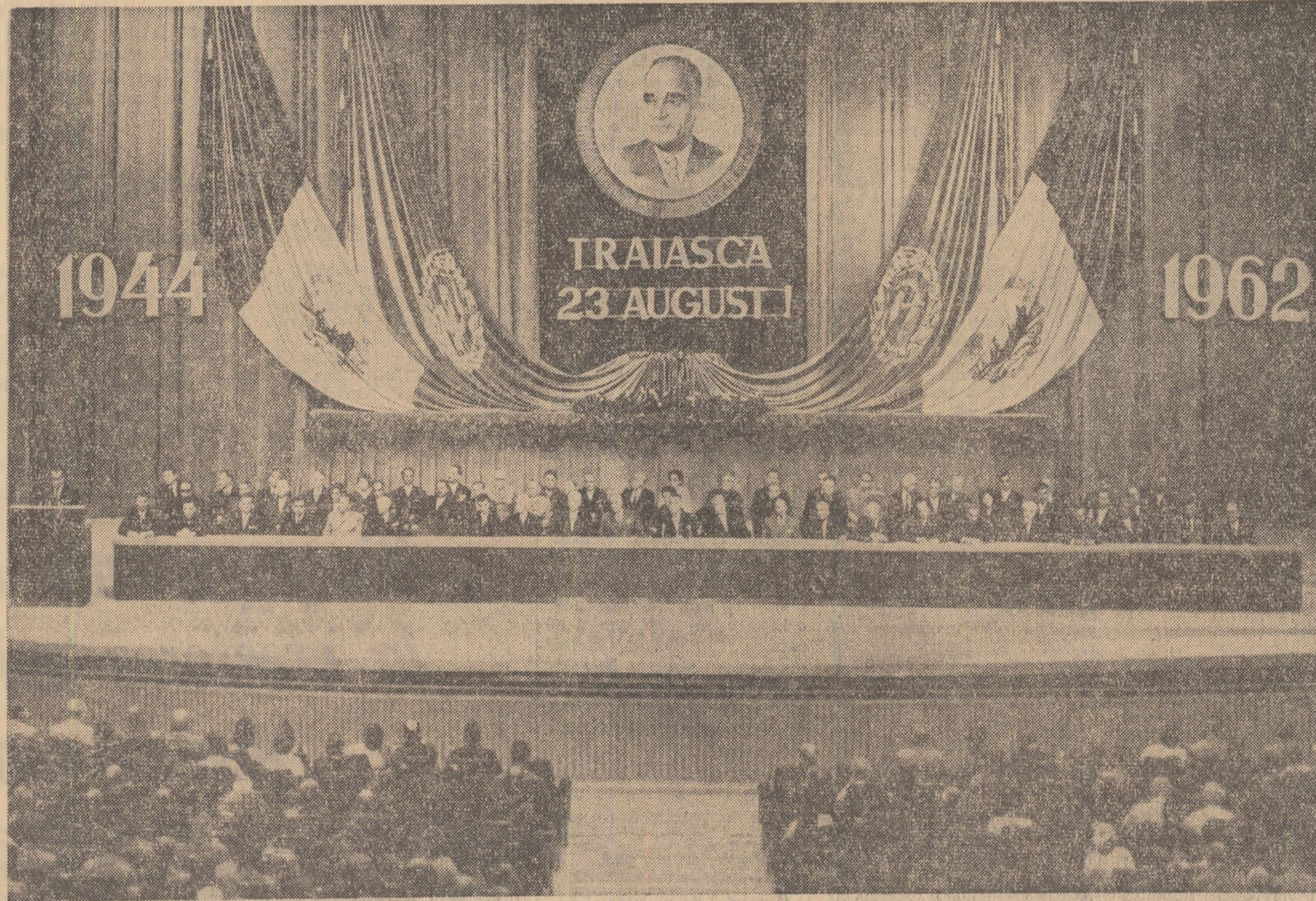
Prezidiul adunării festive consacrate zilei de 23 August.

În sala Palatului R.P. Române a avut loc miercuri după-amiază adunarea festivă organizată de Comitetul orașenesc București al P.M.R. și Comitetul executiv al Statului Popular al Capitalei cu prilejul celei de-a 18-a aniversări a eliberării României de sub jugul fascist.