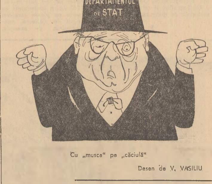
Cu „musca“ pe „căciulă“ Desen de V. VASILIU