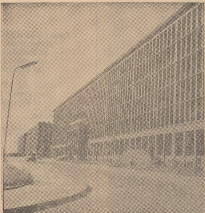
Clădirea Institutului de cercetări și proiectări carbonifere din Katowice (R. P. Polonia)