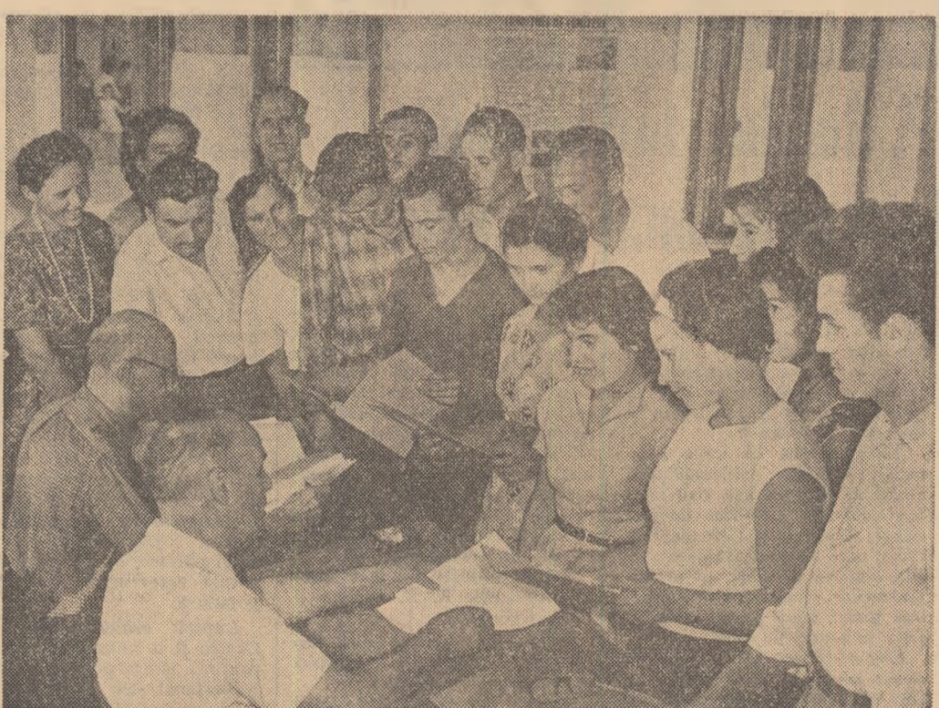
Sala special amenajată pentru cei care vin să se înscrie la examenul de admitere la Centrul școlar agricol din strada Pictor Nicolae Grigorescu nr. 10 — București, este frecventată zilnic de zeci și sute de tineri. Mulți vin aici împreună cu părinții lor.