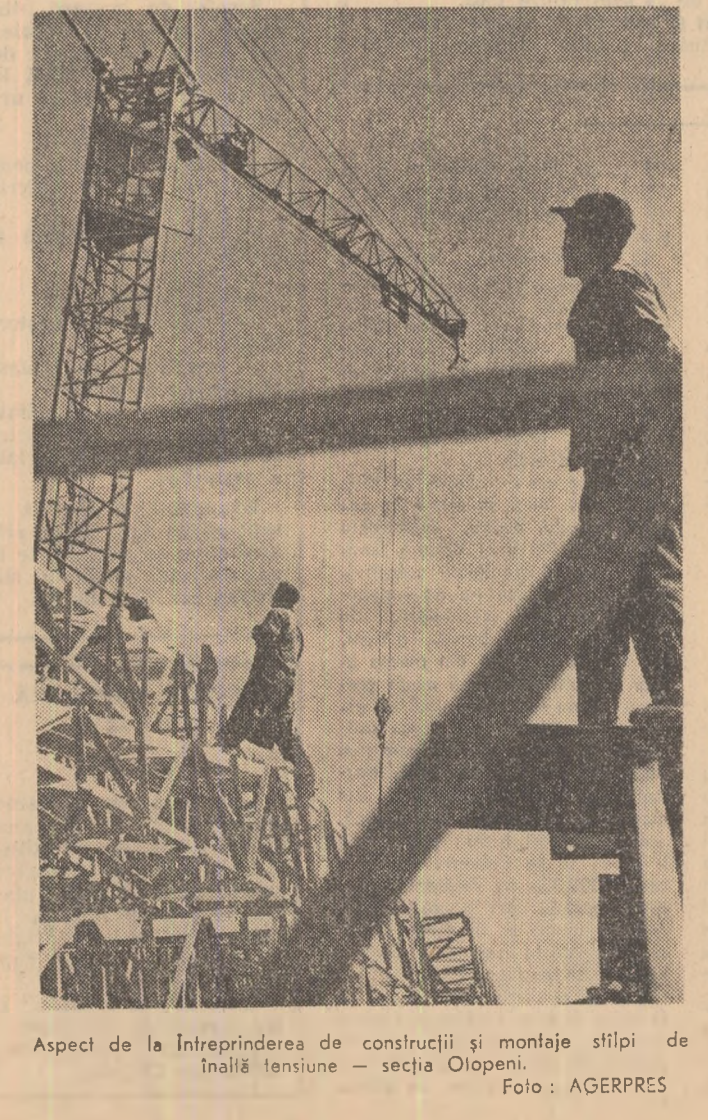
Aspect de la întreprinderea de construcții și montaj stîlpi de înaltă tensiune — secția Otopeni.

Pe măsură ce au fost eliberate țările de păioase, la gospodăria agricolă colectivă din comuna Iosfalău — raionul Lugoj — au început arăturile adînci de vară.