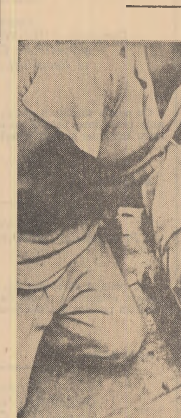
Guvernarea din Republica Dominicană încearcă să înăbușe prin legea lupta patrioților dominicani împotriva regimului dictatorial, pentru libertate și independență națională...