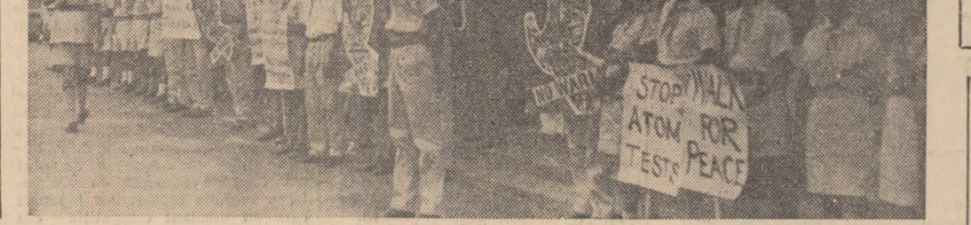
Grupuri de pionieri salută sosirea delegației la recenta conferință „O lume fără bombe”.