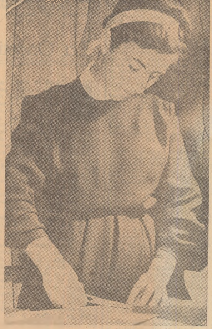
Pregătiri pentru școală.