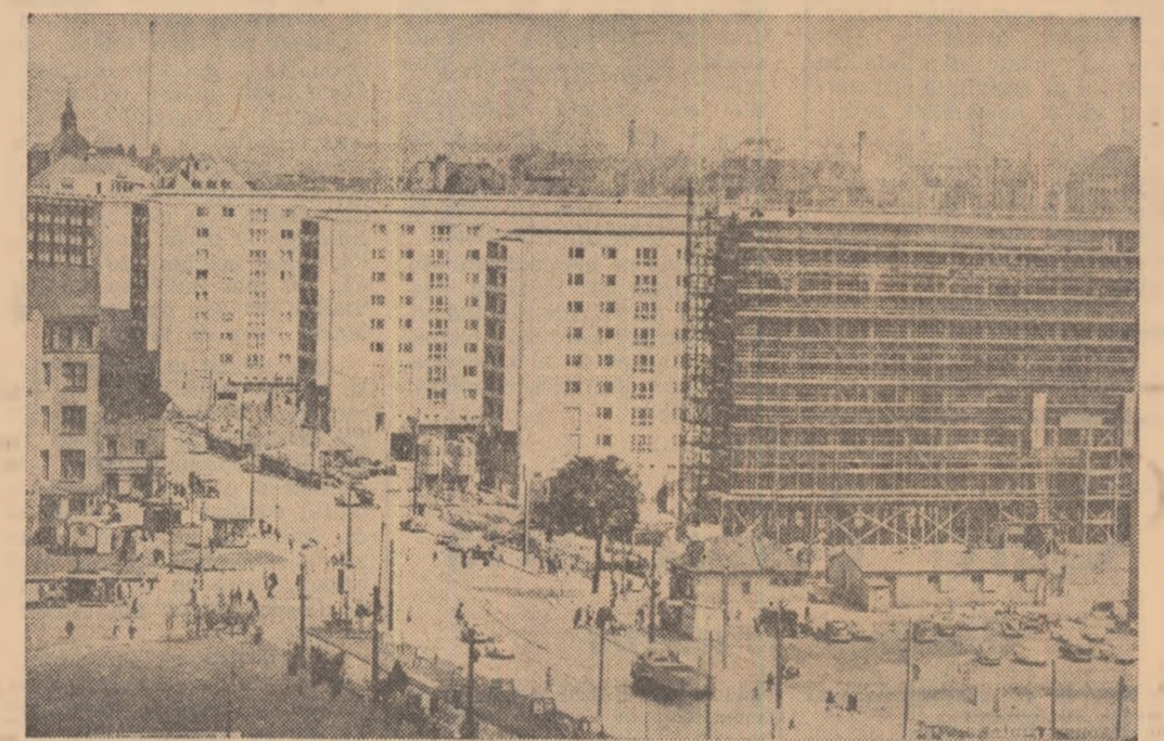
Construcții noi în centrul orașului Karl-Marx Stadt (R.D. Germană).

Anul acesta se vor construi, de asemenea, noi secții la Uzina de automobile „Sachsenring“ din Zwickau, la Uzina de mașini-unelte din Plauen și la modernă fabrică de înobilare a minei de hule „Martin Hoop“ din Zwickau. Vor fi mărite sălile de studii ale școlii superioare de construcții de mașini din Karl-Marx-Stadt și ale Academiei de minerii din Freiberg.