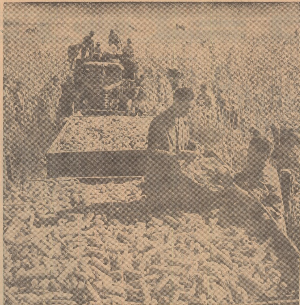
Recoltatul porumbului la secția Loloiasca a G.A.S. Albești din regiunea Ploiești se apropie de sfîrșit. Aici după cele 350 hectare de porumb s-a obținut o bogată recoltă.