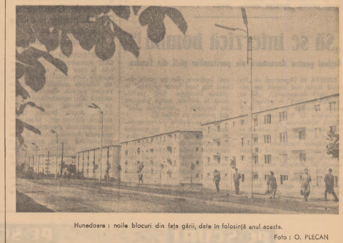
Hunedoara: noile blocuri din fața gării, date în folosință anul acesta.