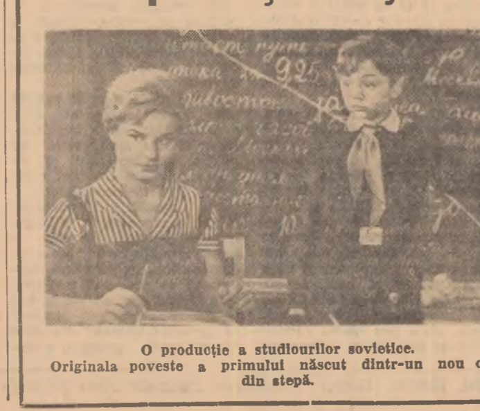
O producție a studiourilor sovietice. Originala poveste a primului născut dintr-un nou oraș din stepă.