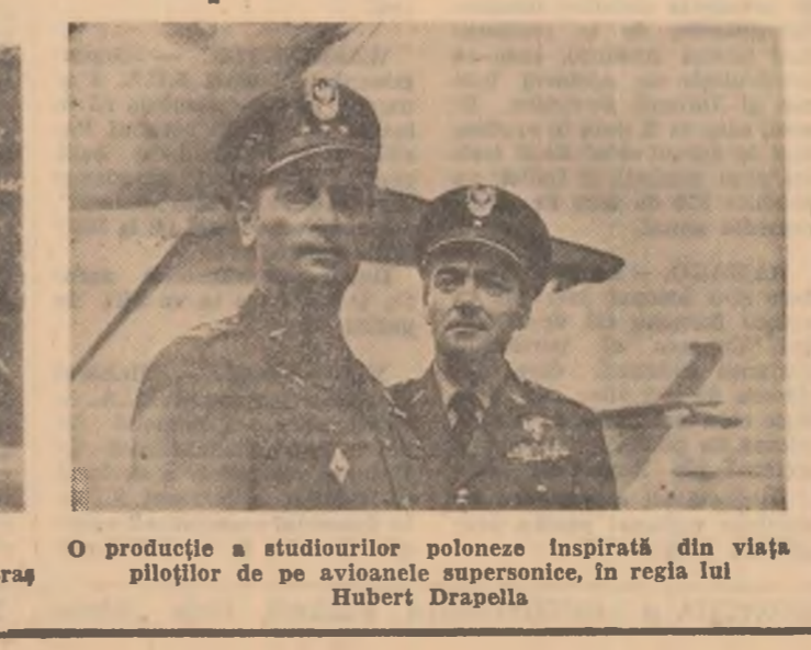
O producție a studiourilor poloneze inspirată din viața piloților de pe avioanele supersonice, în regia lui Hubert Drapella