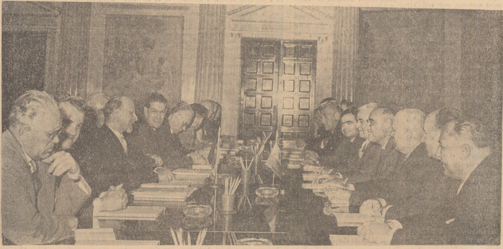
Aspect din timpul convorbirilor între delegațiile de partid și guvernamentale ale R. P. Romine și R. D. Germane