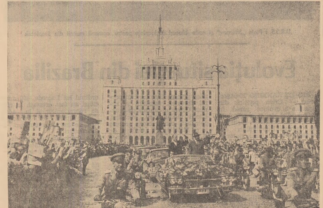
Un mare număr de bucureșteni au salutată călduros pe oșpeți.

Tinerii din Valea Jiului au colectat în cursul lunii trecute aproape 600 tone de metal vechi. În total, de la începutul acestui an, oțelării din țară au primit din Valea Jiului circa 7000 tone de metal. (Agerpres)