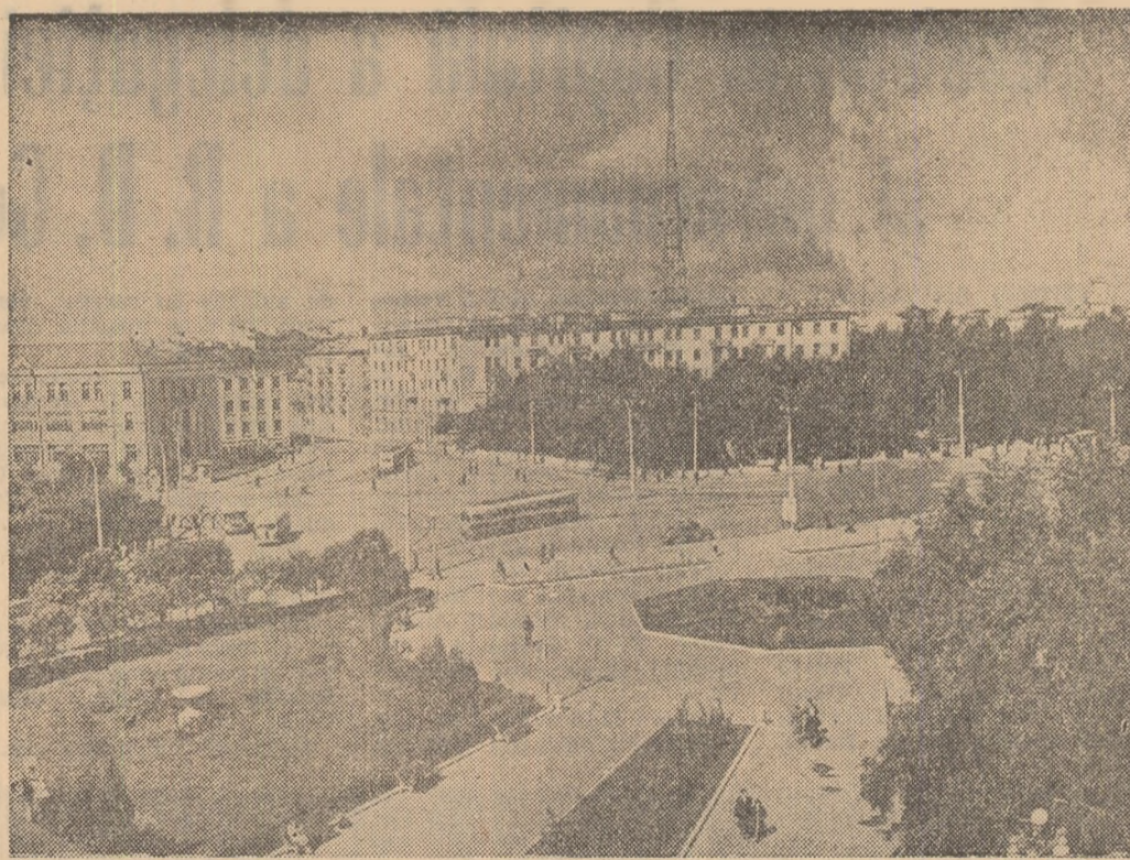
U.R.S.S.: Piața „Smirnov” și noile blocuri de locuințe pentru oamenii muncii din Smolensk

ROMA — Greva foamei de nouă zile, declarată de conducătorul scriitor italian Danilo Dolci, laureat al Premiului internațional Lenin „Pentru întărirea păcii între popoare” și pentru a determina autoritățile să înceapă construirea