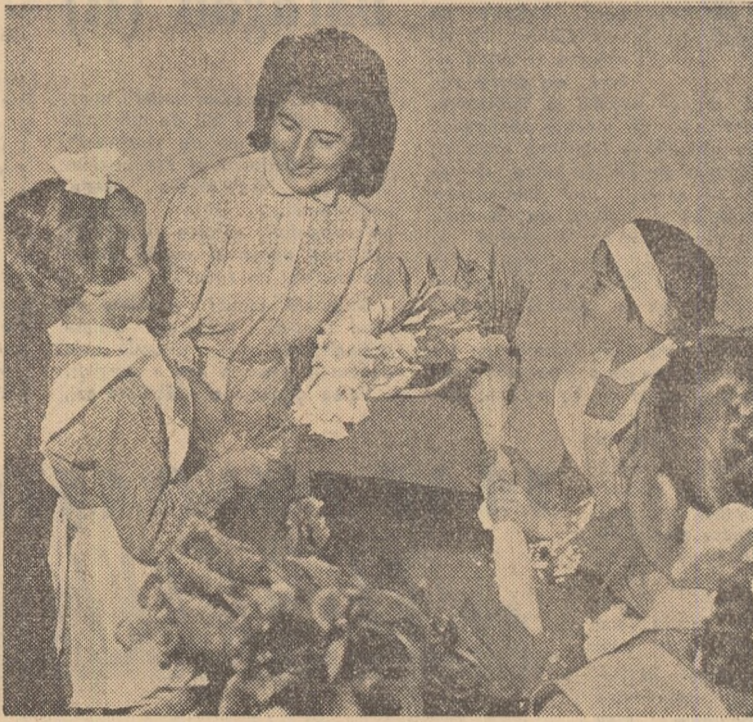
Întîlnire cu tovarășa învățătoare în prima zi de școală.

Simbătă s-au redeschis în întreaga țară cursurile școlilor de cultură generală, profesională și tehnică. După o vacanță plăcută și reconfortantă, petrecută pe culmi de munți sau pe țărmul mării, în drumele și tabere, sutele de mii de elevi s-au reîntors cu profesorii și învățătorii lor, care îi vor ajuta să dobîndescă noi cunoștințe. În această zi de sărbătoare pentru elevii învățămîntului de toate gradele, o dată cu noile localuri de școli s-au inaugurat numeroase laboratoare, biblioteci, ateliere de practică etc. (Agerpres)