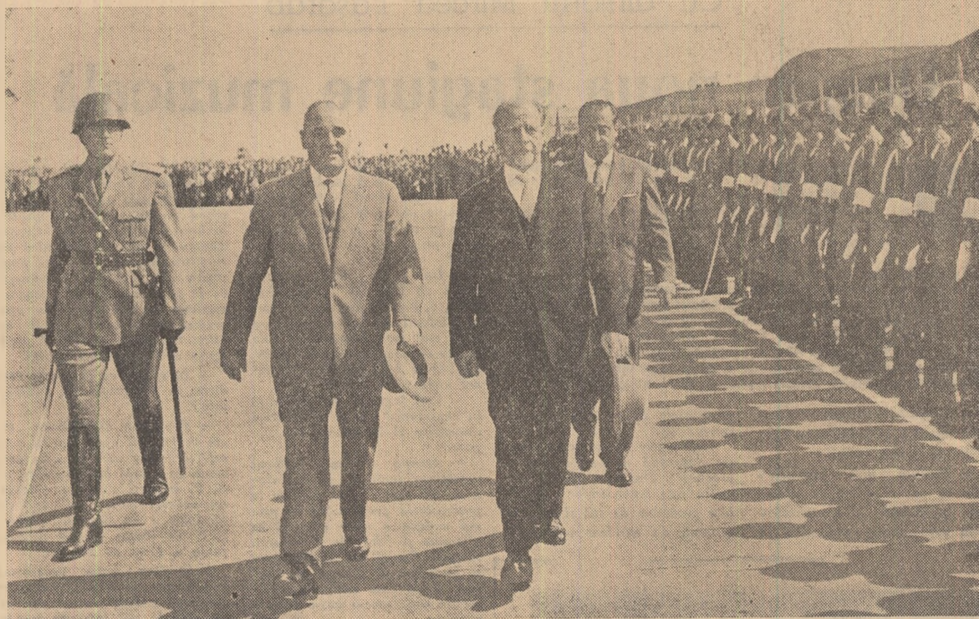
Pe aeroport, la sosirea înalților oaspeți, este însoțit de tovarășa Lotte Ulbricht, soția sa. Aeroportul Băneasa, era pavat festiv cu drapelul de stat ale R. D. Germane și R. P. Romine. Pe clădirea aerogării se aflau portretele tovarășilor Walter Ulbricht și Gheorghe Gheorghiu-Dej. Pe mari pancarte erau scrise, în limbile română și germană, urările „Bine ați venit, oaspeți dragi!”.