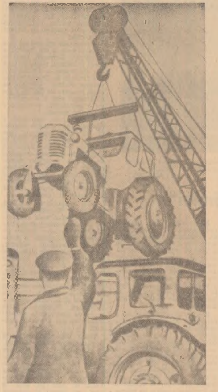
U.R.S.S.: Expedierea unui nou lot de tractoare sovietice pentru oamenii muncii din Cuba.

„Unii senatori americani pot, desigur, să îndemne la o invazie în Cuba. Dar aceștia sînt oameni trecuțului, prezentul nu le aparține” — a declarat prof. John Bernal. „Păreră poporului englez, a spus el, este cît se poate de limpede: nici un război din cauza Cubei, nici un război din cauza Berlinului”.