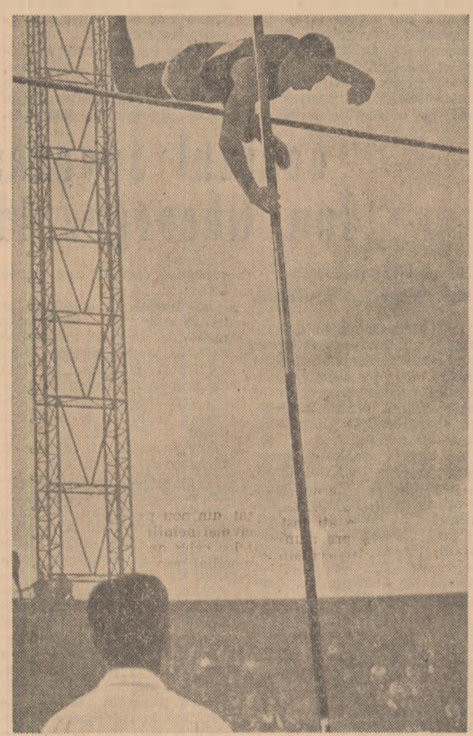
Aspect din timpul probei săritura cu prajina.