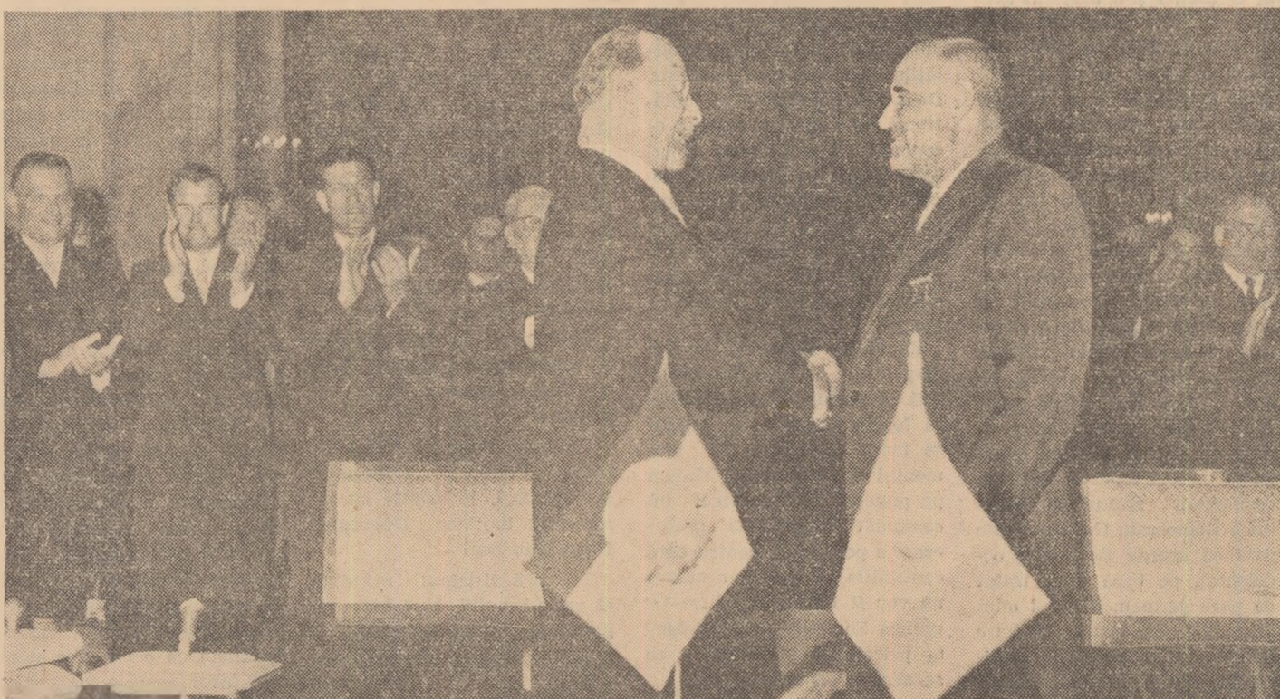
Tovarășii Gheorghe Gheorghiu-Dej și Walter Ulbricht și string cu căldură mîinile după semnarea Comunicatului cu privire la vizita făcută în R. P. Romînă de către delegația de partid și guvernamentală a R. D. Germane.