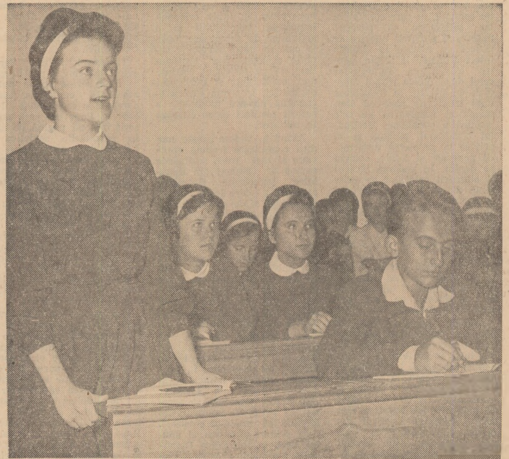
Cînd știi, răspunsul este ușor de dat... chiar dacă ești la ora de matematici.

În timpul mitingului oamenilor muncii din București organizat în cinstea delegației de partid și guvernamentale a R. D. Germane.