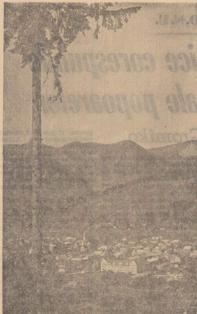
Din frumusețile patriei: Cimpulung-Moldovenesc.

stă părere o împărtășește și delegatul italian Petrone Franco: „Întâlnirea de la București la care am asistat reprezintă o inițiativă valoroasă a cărei utilitate am verificat-o în cele două zile de dezbateri. Ea reprezintă o contribuție la lupta tineretului și popoarelor balcano-adriatice pentru pace în această zonă, pentru înțelegerea între toți acei ce doresc ca ziua de mâine a popoarelor să nu fie umbrită de amenințarea războiului. Exprim gâzdelor române mulțumiri pentru ospitalitatea lor și pentru eforturile depuse spre a asigura reușita acestei întâlniri”.