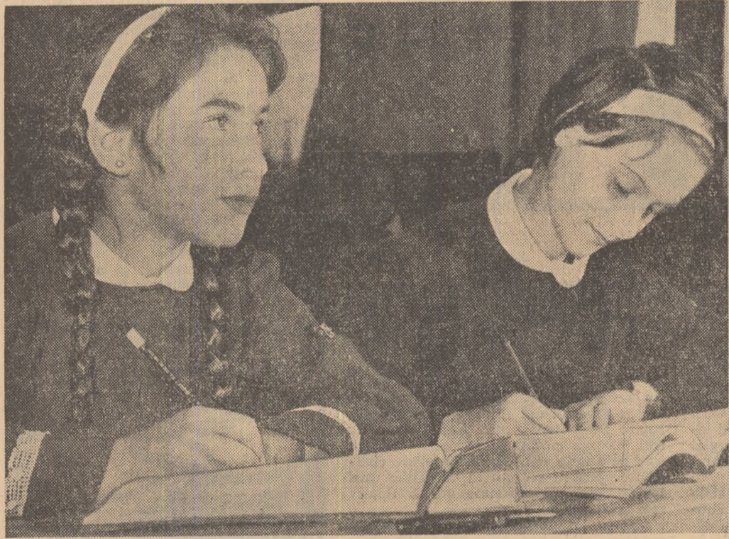
Lección nouă pare să fie grea. Ascultînd însă cu atenție explicațiile profesorului, luînd notițe, elevii își clarifică încă din clasă noțiunile de bază (Ora de fizică la Școala medie nr. 2 „A. Toma” din Ploiești).