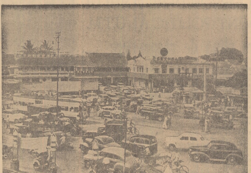
Vedere din Djakarta, capitala Indoneziei.

Ședința Comisiei s-a desfășurat într-o atmosferă de înțelegere reciprocă, prietenie frățeească și colaborare.