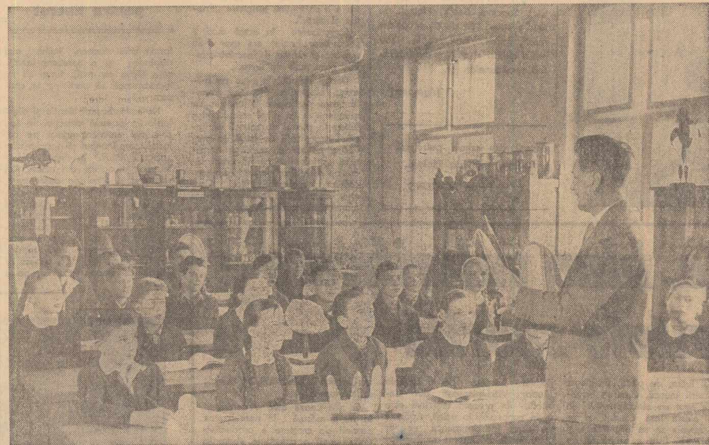
Lecție recapitulativă de agricultură generală la Școala tehnică agricolă din Tg. Mureș.