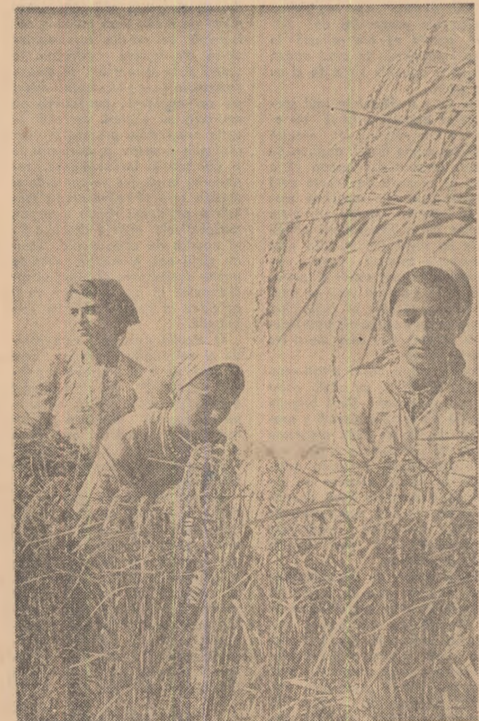
Se recoltează orezul la punctul experimental Chirnoși al Institutului de cercetări pentru cultura cerealelor și planșelor tehnice-Fundulea.