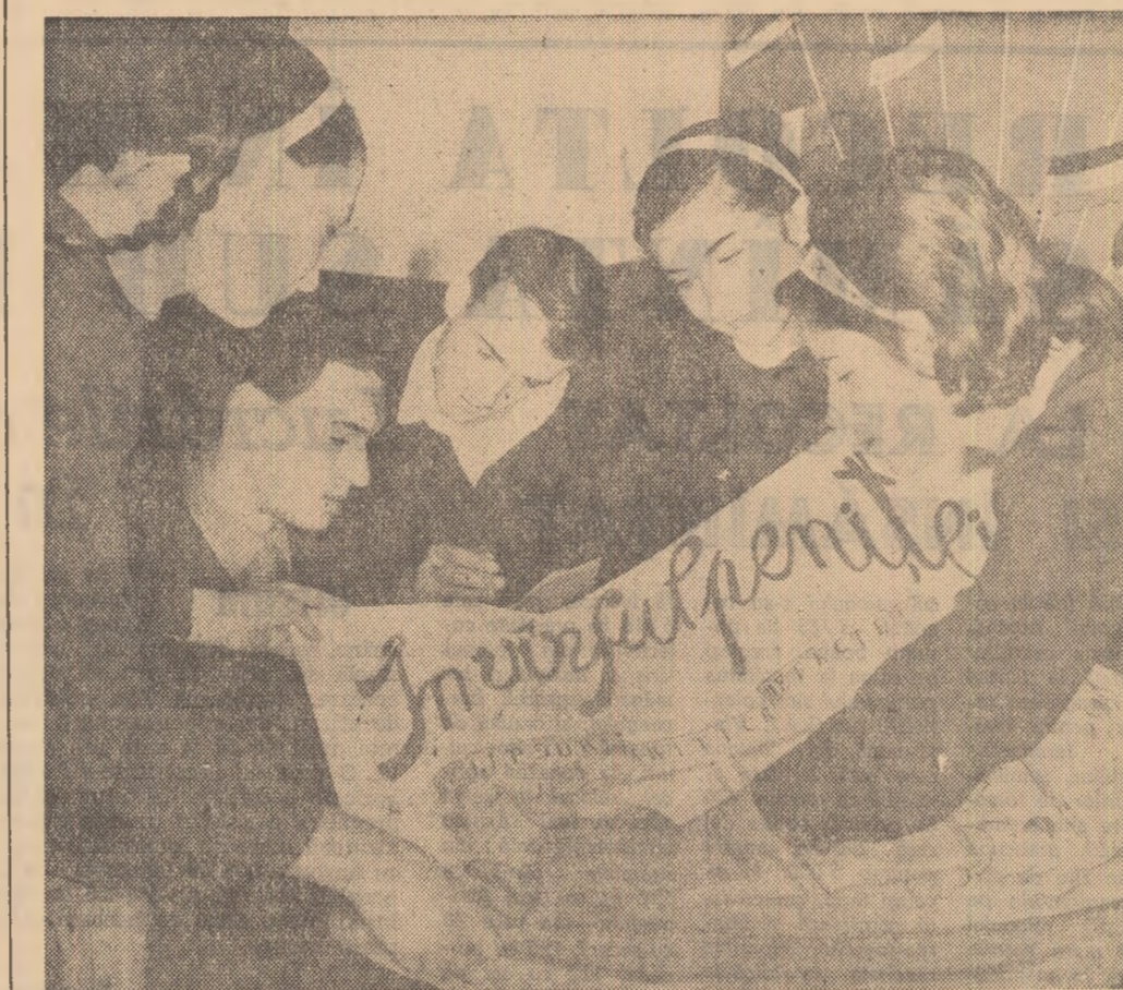
La Școala medie nr. 3 „Mihai Viteazu” din Ploiești se pregătește noul număr al gazetei satirice.