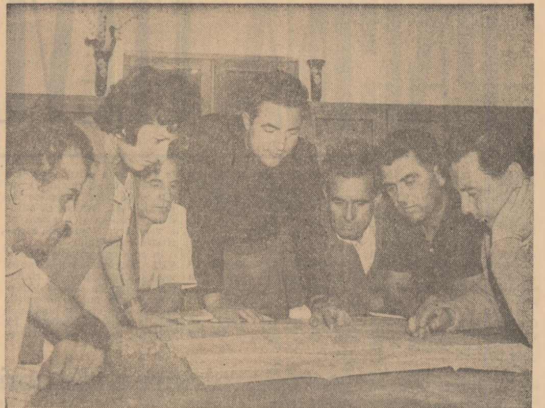
Colectivul de inovatori al Intreprinderii de prefabricate și materiale de construcții-Constanța, în frunte cu inginerul-șef discuta o nouă inovație. Atenția cu care o discută rezultate ce se vor putea realiza în urma aplicării ei în producție.