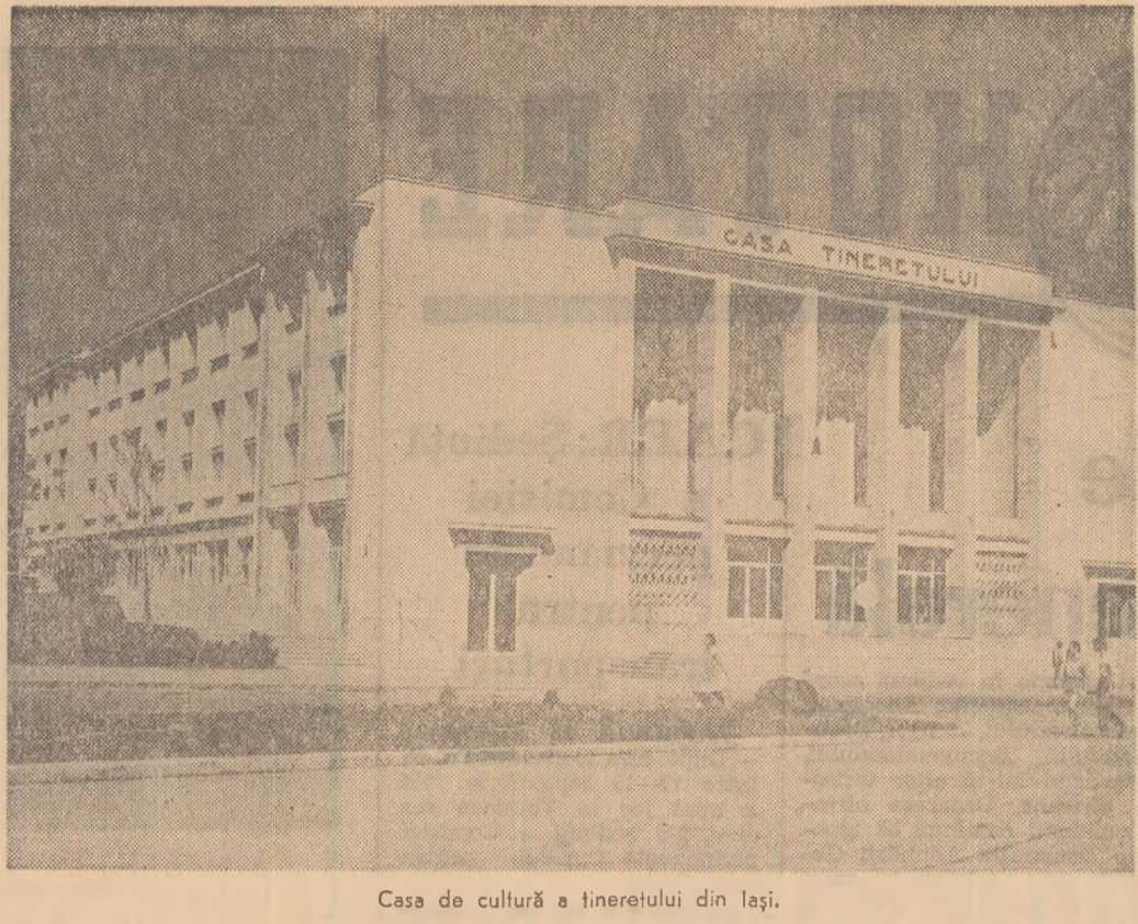
Casa de cultură a tineretului din Iași.