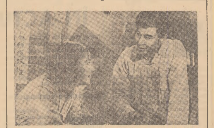
O producție a studiourilor din R.P. Chineză

MINISTERUL MINELOR ȘI ENERGIEI ELECTRICE GRUPUL ȘOLAR ENERGETIC-ELECTROTEHNIC BUCUREȘTI