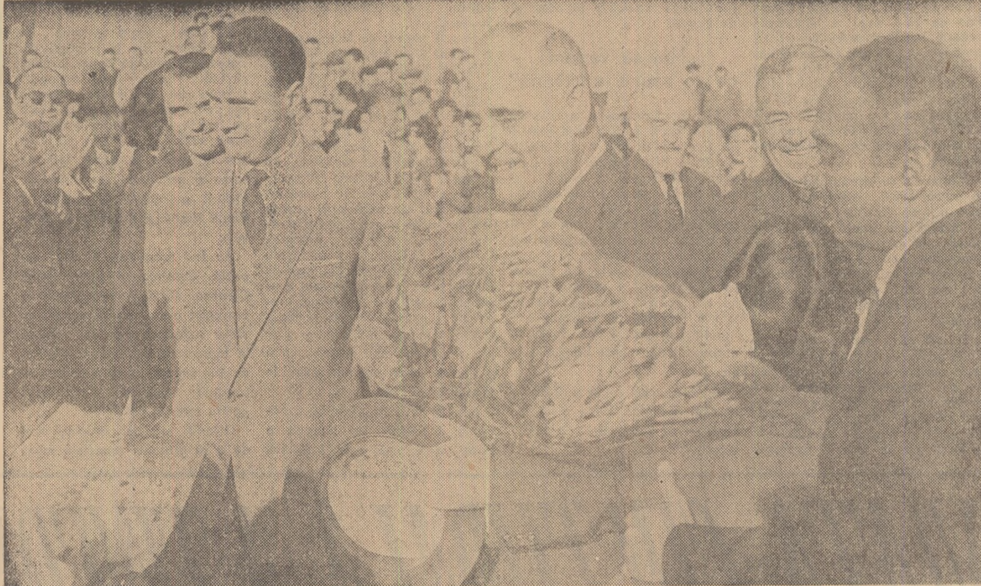
La plecare pe aeroportul Băneasa

Vineri dimineață, președintele Consiliului de Stat al Republicii Populare Romîne, Gheorghe Gheorghiu-Dej, împreună cu președintele Consiliului de Miniștri, Ion Gheorghe Maurer, și ministrul afacerilor externe al R.P. Romîne, Corneliu Mănescu, au părăsit Capitala, plecînd într-o vizită în Indonezia și India la invitația președintelui și primului ministru al Republicii Indonezia, dr. Sukarno, și președintelui Republicii India, dr. Sarvapalli Radhakrishnan.