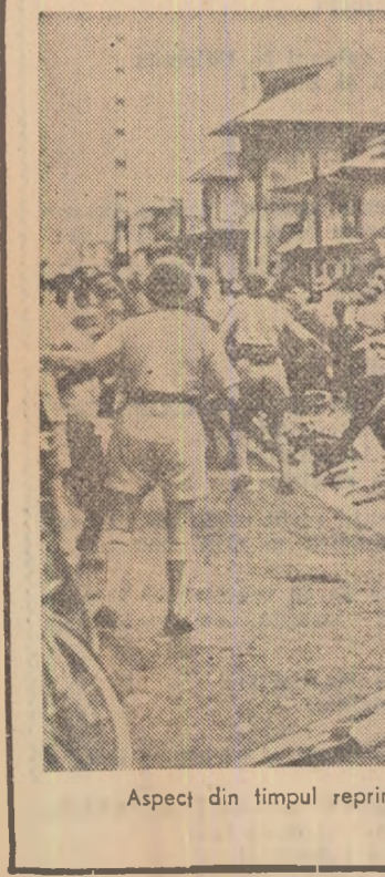
Aspect din timpul reprimării unei demonstrații pașnice a populației din Guyana franceză.