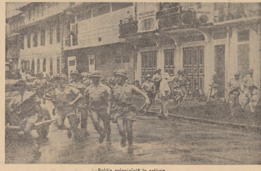
Poliția colonialistă în acțiune...

capitala acestei țări. Dar „falma” Guyanei franceze a fost legată de celebrul loc de deținuțiune de pe „Insula dracului”. Aici, la sfîrșitul secolului al 19-lea, lupătoriai Comunei din Paris care au scăpat de gloanțele regimului autocrat, au fost deportați pentru a fi izolați. Clima insuportabilă, muncile extenuante au secerat mii de vieți. Mai tirziu „Insula dracului” avea să găzduiască pe căpitanul Dreifus, victimă a celui mai scandalos proces politic din istoria Franței secolului al XIX-lea. Colonialiștii au fîntit însă mai departe. Populația locală a fost decimată. In locul băștinășilor, în Guyana franceză