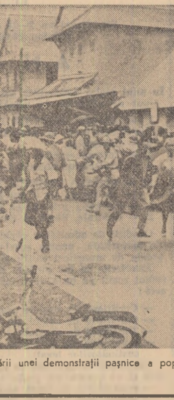
Populația lese în stradă

au fost aduși sclavi negri din Africa. Ei au fost puși să muncesc pe plantațiile de cacao, trestie de zahăr și cafea ale colonialiștilor. Așa se face că în prezent 90 la sută din cei peste 30.000 de locuitori ai Guyanei sînt negri. Ei ocupă un teritoriu care ca suprafață reprezintă o treime din întreg teritoriul Franței. Numită oficial un „departament” al Franței, ovină aceleși regim ca insulele Martinica și Guadelupa din arhipelagul Caraibilor, Guyana franceză este în realitate o colonie extrem de înapoiată din punct de vedere economic, social, cultural. Cîteva zile mai tirziu, demonstrațiile au reînceput. Populația țării a protestat de data aceasta împotriva intențiilor de a „exila” aici pe străini dintre conducătorii O.A.S.-ului. Din nou au răsunat focuri de armă și au explodat grenade cu gaze lacrimogene. In spitalul din Cayenne au fost internate mai multe persoa-