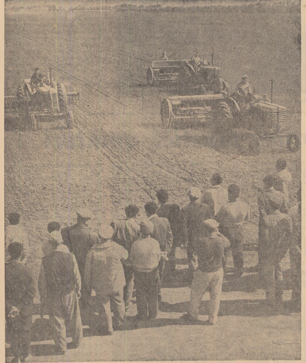
În pămîntul prășit din vreme, mărunțit ca boabele de mazăre, semănătorile îngroapă bob cu bob grîul. Totul se face ca la carte. A fost o lecție deosebit de utilă pentru participanții la această interesantă demonstrație practică organizată la stațiunea experimentală agricolă Mărculești.