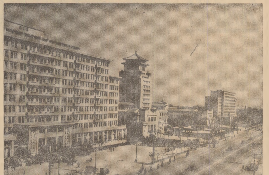
R. P. Chineză: Vedere parțială din orașul Pekin