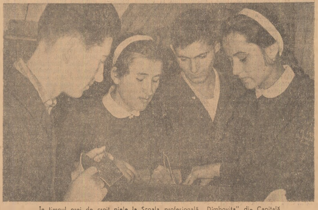
În timpul orei de croit piele la Școala profesională „Dimbovița” din Capitală.