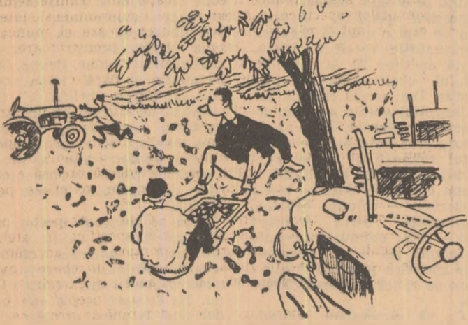
— Unde a zbughit-o? — Ne-au făcut semn că s-a mai eliberat o parcelă. — Ei, atunci multă caldă că pînă la parcela următoare mai putem face cinci, șase parcele...

Îndată ajunse în gospodărie (în porzolor) cu substanțe insectofungicide. Este o acțiune la care, ca și în alți ani, tinerii colectivii, mobilizați de organizațiile U.T.M. pot aduce o importantă contribuție.