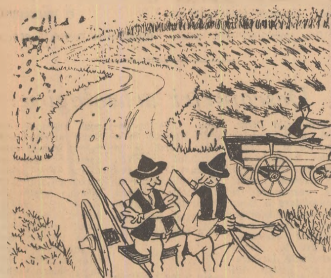
— Și după ce transportăm polcoavele astea cîrmă cocenii? — Nu cred. O să mai avem de dus niște oale la Pitești... Desene: MIHAI CARANFIL

La gospodăria colectivă din comuna Văleni, regiunea Argeș, nu se poate începe semănatul pentru că nu s-a arat și nu s-a arat delîncă terenul n-a fost eliberat de coceni, iar cocenii n-au fost transportați pentru că atelajele gospodăriei sînt ocupate cu treburi foarte „importante”.