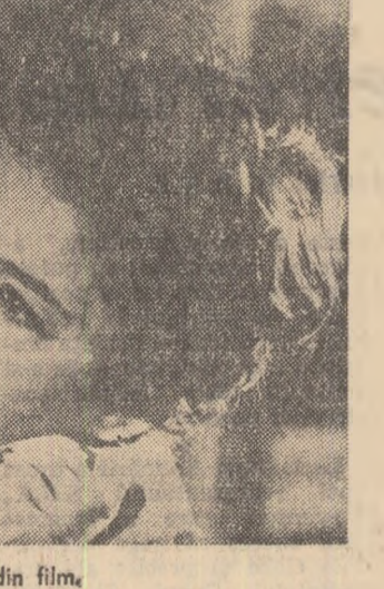
O scenă din film.

toare țărilor socialiste împreună cu întreaga omenire progresistă, desfășoară o neobosită luptă pentru pace, împotriva deziluziilor de către imperialiști a unui nou război mondial; ele luptă activ pentru dezarmarea generală și totală, pentru interzicerea experiențelor cu arme nucleare, pentru încheierea tratatului de pace cu Germania și normalizarea situației în Berlinul occidental, pentru rezolvarea cât mai grabnică a celorlalte probleme internaționale care nu suferă amânare.