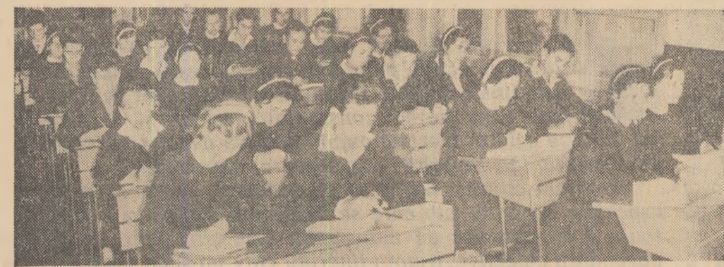
Oră de limba romînă la clasa a X-a D a Școlii medii nr. 2 „A. Toma” din Ploiești.