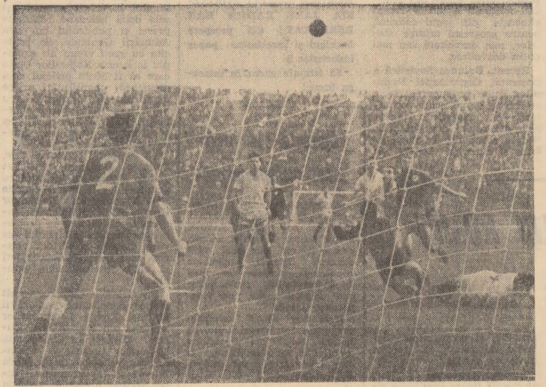
Imagine de la înfrîngerea de fotbal Steaua-Farul