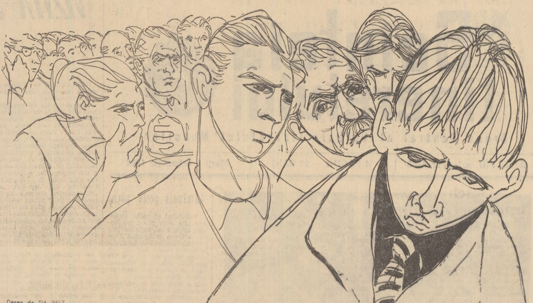
Desen de TIA PELZ