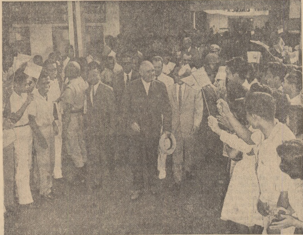
Studenții Universității din Djakarta au făcut o călduroasă primire solilor poporului romîn.

• Marele miting de la Djokjakarta • Cuvîntările rostite de tovarășul Gheorghe Gheorghiu-Dej și de președintele Sukarno