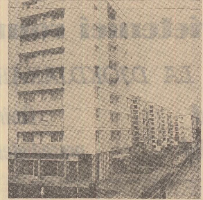
Construcții noi la Oradea

In cursul dimineții de luni, delegația Asociației de prietenie sovieto-romine a făcut o vizită la Consiliul General A.R.L.U.S. Delegația a fost întâmpinată de conducătorii ai Consiliului General A.R.L.U.S., de reprezentanți ai Ministerului Afacerilor Externe, Comitetului de radio și televiziune, ai Institutului român pentru relații culturale cu străinătatea, ai Comitetului de stat pentru cultură și artă, de membri și activiști ai Consiliului General A.R.L.U.S. Vizita s-a desfășurat într-o atmosferă de căldură prietenească. Membrii delegației au făcut, de asemenea, o vizită la Muzeul de istorie a partidului din Capitală.