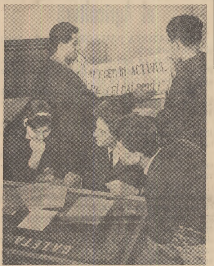
Colectivul gazetei de perete de la Școala medie nr. 39 Dimitrie Cantemir din Capitală pregătește un număr nou pe tema alegerilor...