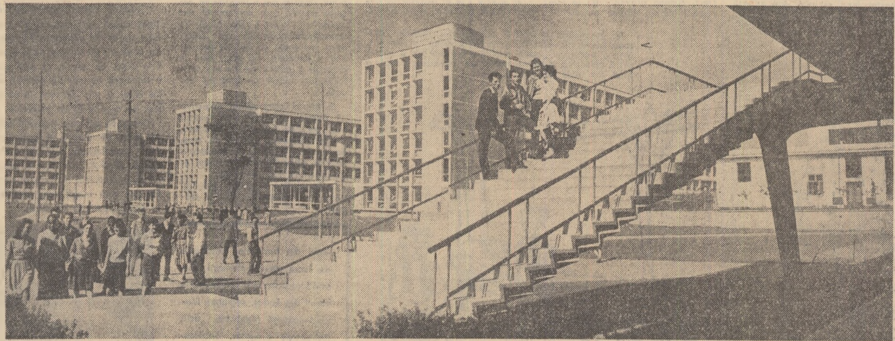
Complexul social-Grozăvești, unul din cele două „orașe ale studenților”, înălțate în București, pe cheiul Dimboviței.