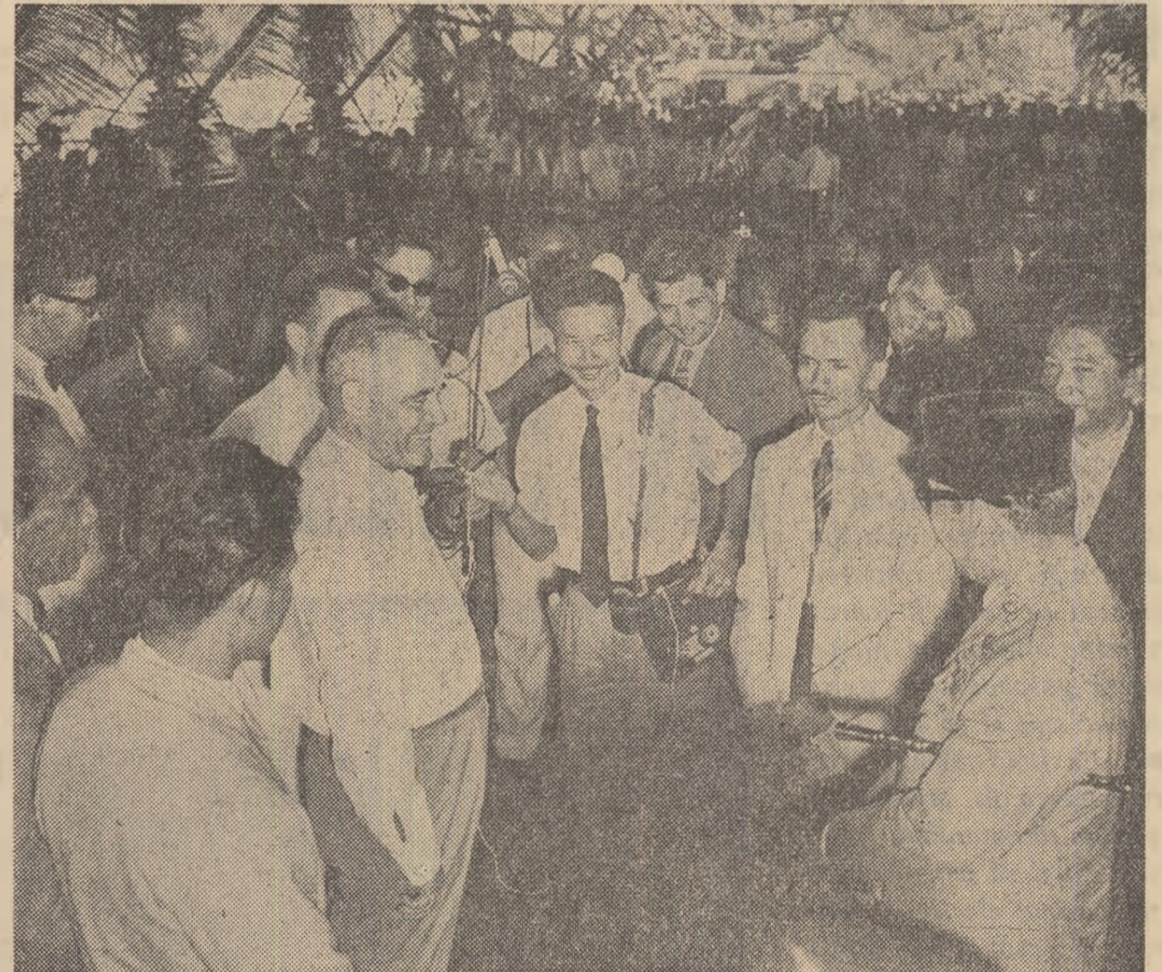
Solii poporului român în vizită la marele șantier al hidrocentralei de la Djaliluhur