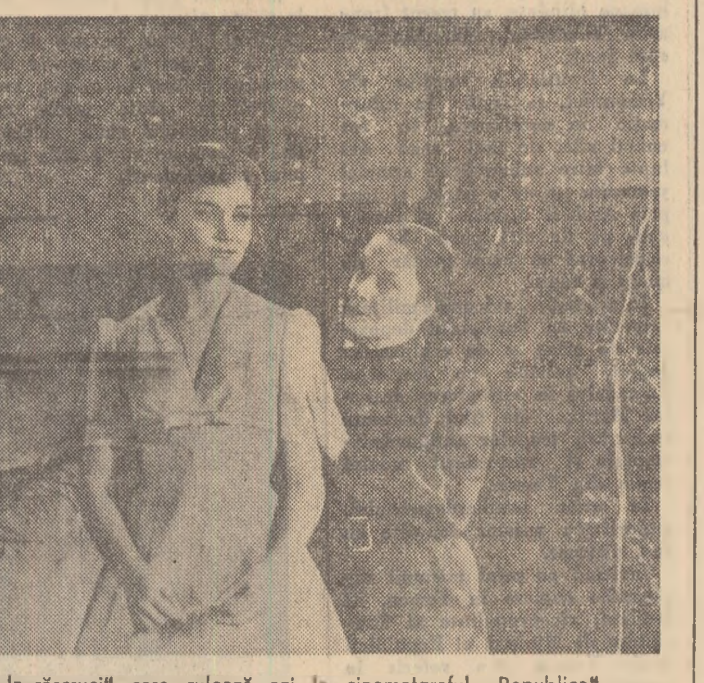
Scenă din filmul „Casa de la răscruce” care rulează azi la cinematograful „Republica”