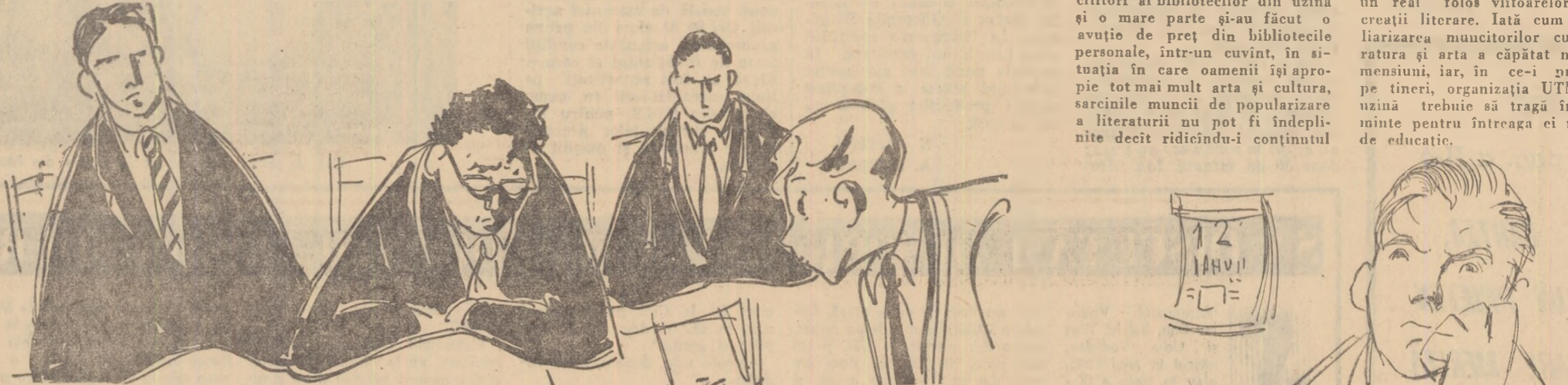
— Cite cărți ai citit? Spune repede, că n-avem timp de pierdut.

Concursul „Iubiți cartea” este o acțiune educativă, una din formele de educație comunistă a tineretului. Modul în care se desfășoară el, conținutul activităților care au loc în cadrul acestui concurs trebuie să fie în pas cu viața tineretului, cu cerințele noi ale muncii educative de masă.