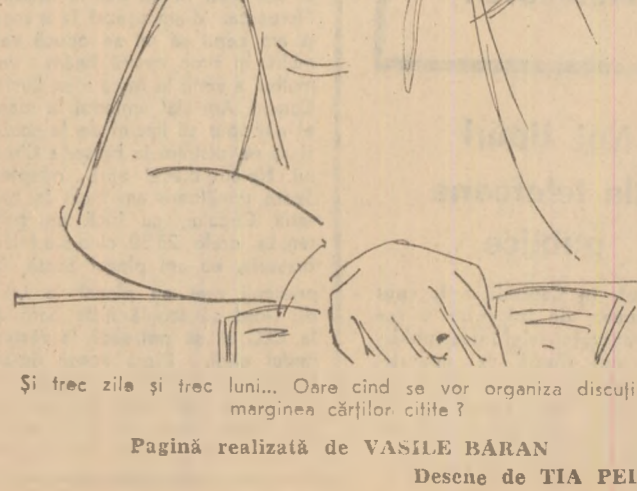
Și trec zile și trec luni... Oare cînd se vor organiza discuții pe marginea cărților citite?

Concursul „Iubiți cartea” este o acțiune educativă, una din formele de educație comunistă a tineretului. Modul în care se desfășoară el, conținutul activităților care au loc în cadrul acestui concurs trebuie să fie în pas cu viața tineretului, cu cerințele noi ale muncii educative de masă.