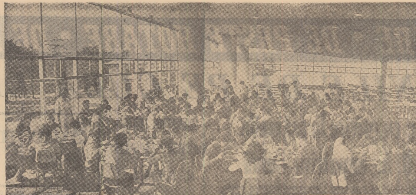
In sala de mese a noii cantine studențești de la Complexul social Grozdiești.