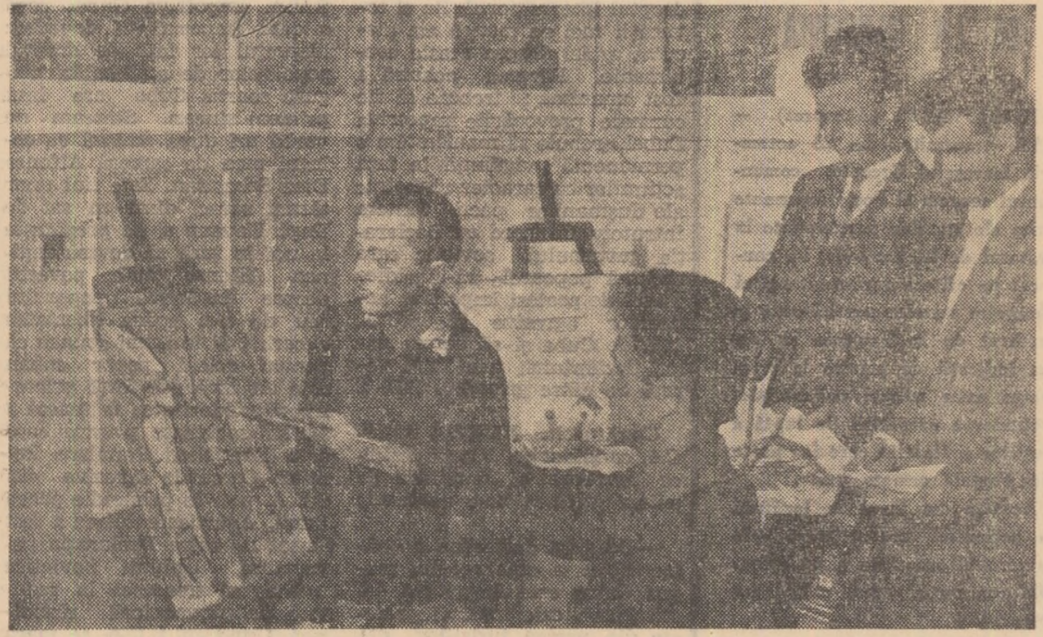
Ynari pictori amatori la cercul de artă plastică al clubului Fabricii de rulmenți din Birlad.