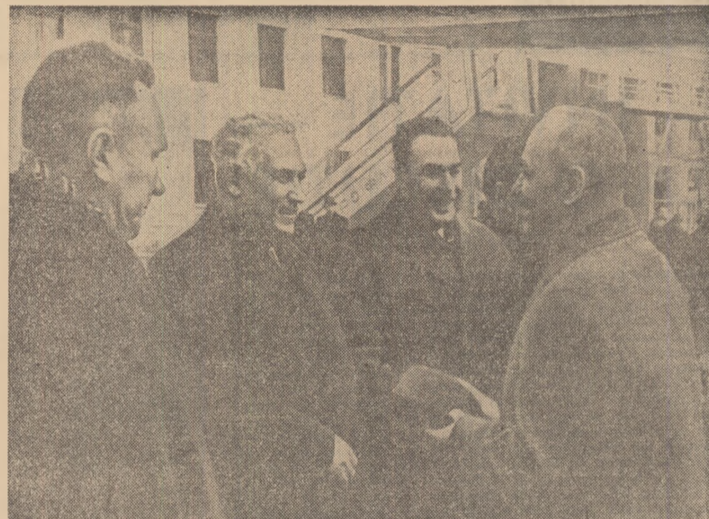
La sosire, pe aeroportul Vnukovo.