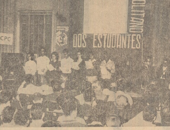
Aspect de la recentul congres al studenților brazilieni la Rio de Janeiro. În timpul votării rezoluției de solidaritate cu eroul popor cuban, rezoluție adoptată în unanimitate.