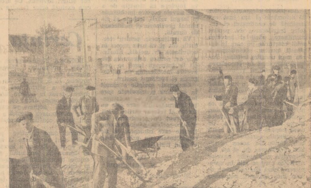
Tineri constructori de rulmenți din Birlad la muncă patriotică.

Colectarea fierului vechi și expedierea lui pe adresa oțelăriei patriei constituie o preocupare permanentă a tinerilor muncitori ai Fabricii de țevi din Roman. Așa, de pildă, tinerii din secția filetaj au colectat de la începutul anului 2 701 tone de fier vechi; cei din secția laminor au expediat oțelăriei 11 430 tone fier vechi. Numai în trimestrul III al acestui an din februarie au plecat spre Rășia și Hunedoara aproape 13 000 tone fier vechi, colectat în mare parte cu contribuția tineretului.