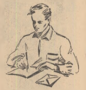
rele gospodăriei sînt brazdate rînduri, rînduri...“

„Erau prin toamna anului trecut cînd, într-una din zile, la sectorul energo-mecanică a apărut un alif. Muncitorii secției erau invitați să participe la o ședință a consiliului de judecată. Cîte treburi nu avea de făcut fiecare în acea după-amiază? Și, totuși, majoritatea au renunțat la aceste preocupări cotidiene și au fost prezenți în sala clubului. Ce se întimplase? Unul dintre tineri (să ne ierle cititorii că nu-i spunem numele, dar el este astăzi un băiat foarte bun) fusese surprins la poartă în momentul cînd încerca să scoată pe ascuns cîteva zeci de grame de fire de lînă. Cantitatea era alt de mică, încă nu se putea face din ea nici o pereche de mănuși. Unii ar fi trecut poate cu vederea o asemenea faptă. În colectivul nostru nu se putea însă întimpla așa ceva. Greșeala era destul de mică, ea arăta totuși intenția de a fura din bunul obște. Or, ce poate fi mai urit, mai nedemn decît să întinzi mina și să sîrtești pentru tine bunurile care ne aparțin nouă, tinerilor?