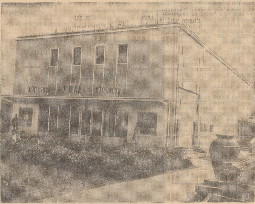
Noul cinematograful în orașul Fălcieni, regiunea Suceava.