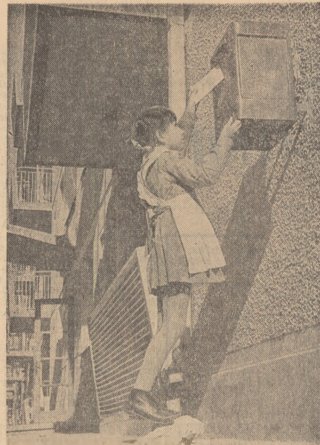
Scrisoare pentru „Aschiuță”