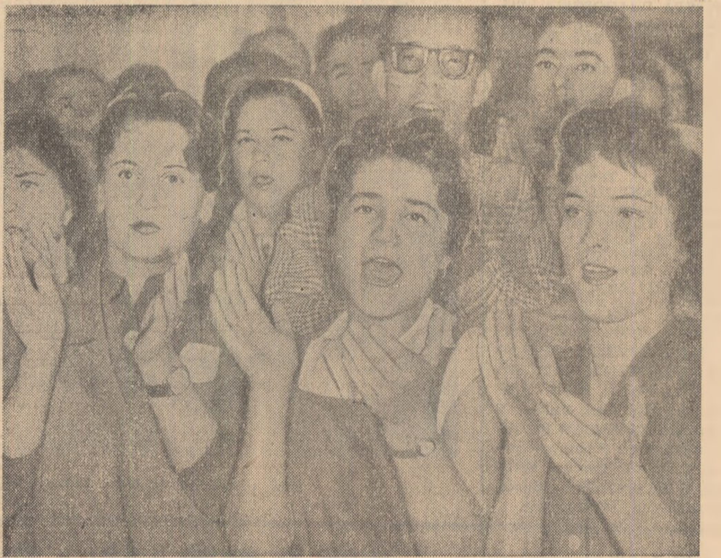
„Ceram să se pună capăt măsurilor arbitrate luate de S.U.A. împotriva Cubei!” — a fost cuvîntul participanților la mitingul care a avut loc la întreprinderea textilă „Dacia”.