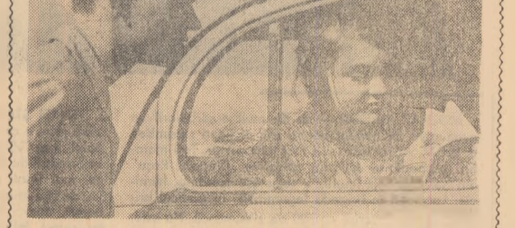
O coproducție a studiourilor „M. Gorki” și a studioului „Defa”-Berlin, după libretul Tamarei Makarova.