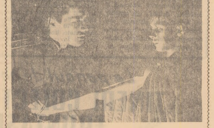
O producție a studiorilor „Mosfilm”, după povestirea lui V. Bogomolov „Ivan”

Distins cu premiul „Leul de aur” la Festivalul internațional al filmului de la Veneția-1962 și cu „Premiul de excelență” pentru calități tehnice și metode de filmare la Congresul internațional tehnic de la Moscova 1962.