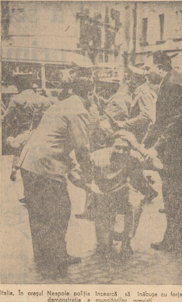
Italia. În orașul Neapole poliția încearcă să înăbușe cu forța o demonstrație a muncitorilor greviști

În răspunsul președintelui Kennedy, transmis lui U Thant, de către Stevenson, se arată că