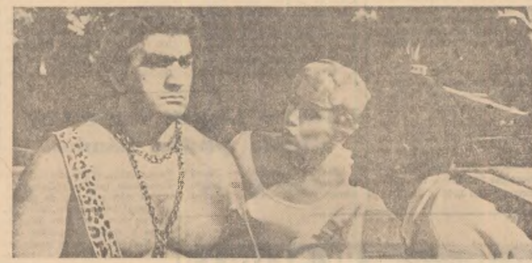
Scenă din film