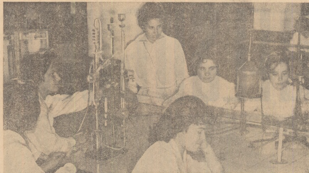
Într-unul din laboratoarele Universității „Al. I. Cuza” din Iași.