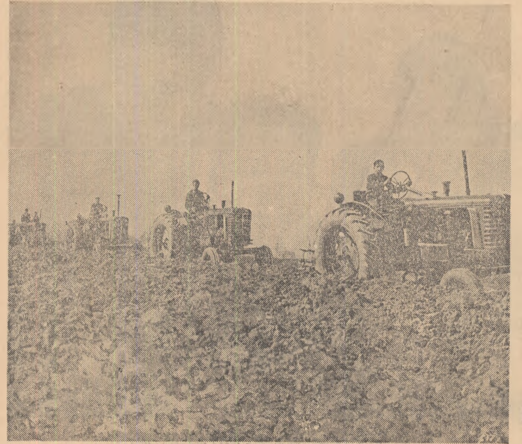
Temelia recoltelor anului viitor se pune încă de pe acum. Mecanizatorii de la S.M.T. Euda regiunea Ploiești efectuează ogoare de toamnă pentru însămîntările din primăvara viitoare.