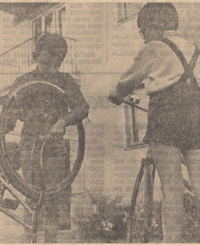
O pană de cauciu.