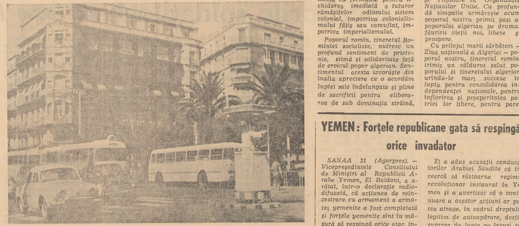
În centrul orașului Alger — capitala Republicii Algeriene Democratice și Populare.

NEW YORK. — După citeva zile de acalmie relativă în statul Mississippi rasisti s-au dedat din nou la excese. În noaptea de 30 spre 31 octombrie, în orașul Oxford rasisti au săvîrșit de autoritățile statului un atac împotriva manifestanților deszăsurate la Milano în sprijinul Cubei.