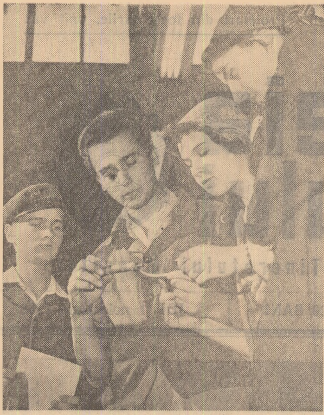
Elevi de la Complexul școlar din Birlad în practică la Fabrica de rulmenți din localitate.