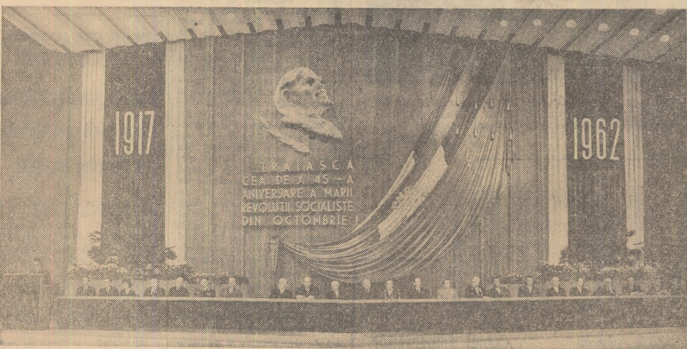
Prezidiul adunării festive