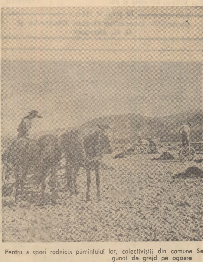
Pentru a sporii rodnicia pămîntului lor, colectiviișii din comuna Seini, regiunea Maramureș, împraștii gunoi de grajd pe ogoare

ență. La repartizarea lor, maistrul ține cont de aptitudinile, de posibilitățile fizice, de vîrstă, de experiență și mulți alții. Maistrul nostru se interesează îndeeaproape atît de felul cum muncesc tinerii, cît și de felul cum își petrec timpul liber. Un sînt despre felul cum să ne imbricăm, sau cum să ne comportăm într-o situație sau alta, este bine venit. La ședințele organizației U.T.M. maistrul nostru e nelipsit. El se află mereu acolo unde este nevoie. De aceea, atît muncitorii vîrstnici din secția noastră cît și tinerii, îl stimează și îi urmează cu încredere sfaturile. ION MOCANU recepționar