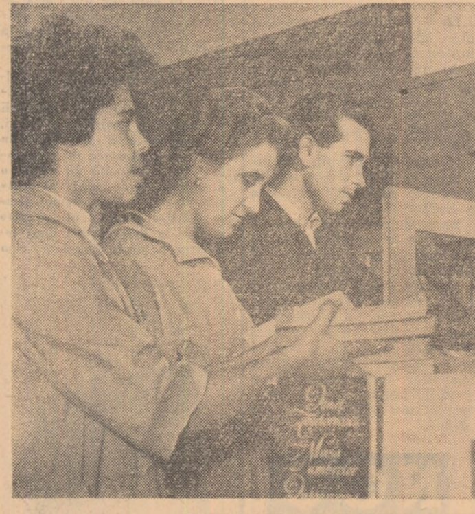
La una din bibliotecile de secție de la Fabrica de tricoteje „Moldova” din Iași.

TINERI și TINERE! Participînd în număr cit mai mare la acțiunea de colectare a fierului vechi, contribuțiți în acest fel la sporirea producției de oțel a patriei.