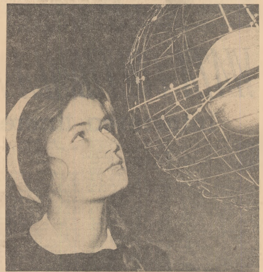
Privind în acest fel, bolta cerească își pierde poate din poezie — dar își dezvăluie mai bine tainele în fața elevilor care studiază astronomia.

La G.A.C. „Zorile socialismului” din comuna Măcănești, regiunea Galați, stau aruncate, cîntărește de cîți ani, diferite piese scoase din uz care cîntăresc 3 tone. De ce nu se predau? Cîcă se așteaptă formarea unei comisii de inventariere care să vadă dacă nu cumva se mai poate folosi ceva... Situații asemănătoare se găsesc și în satele care aparțin acestei comune, Tăturu, Stupina etc. Organizația U.T.M. de aici n-au acționat așa cum trebuie pentru ca tinerii să colecteze cît mai mult fier vechi. ● Trustul de extracție Moinești are circa 500 tone de utilaje casate pe care nu le predă I.C.M.-ului motivînd că nu are cu ce le înlocui. Fiind vorba de fier vechi este timpul ca tovarășii din conducerea trustului să ia înfățișat măsurile corespunzătoare. ● Un fucular de circa 10 tone, care nu funcționează, se află la minele Surduc din cadrul întreprinderii miniere „Ardealul”. De ce nu se fac formele de casare? ● La Uzina electrică Jibou există un motor vechi care cîntărește 12 tone. De ce nu se predă la I.C.M.? ● La Baza a 6-a aprovizionare-lăși se află circa 80 tone de fier vechi, la baza 14 aprovizionare-Suceava circa 60 de tone diferite piese agricole care nu se mai folosesc, dar care nu se predau I.C.M.-ului. ● Trustul de construcții-montașe Căpușa, regiunea Cluj, deține 10 tone de deseurii de fier. Pentru ce nu le trimite I.C.M.-ului?