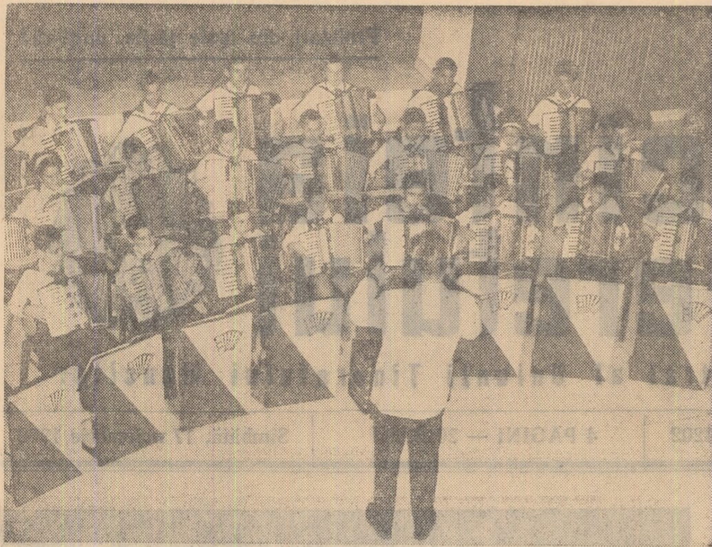
Orchestra de acordeoane a Casei de cultură din raionul 16 februarie în timpul unei repetiții