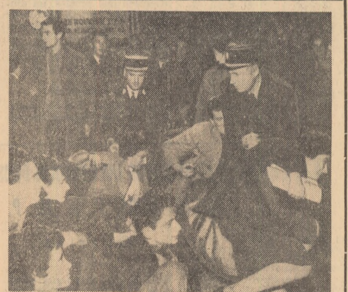
Studenți parizieni protestează împotriva condițiilor grele de studiu și de viață; poliția încearcă să răspundă cu forța o demonstrație studențească.

casă cu două etaje din piața Percy-Circus nr. 16, unde a locuit Lenin la sfîșitul lui aprilie 1905, cînd a venit de la Geneva la Londra pentru a organiza Congresul III-lea al revoluției socialiste.