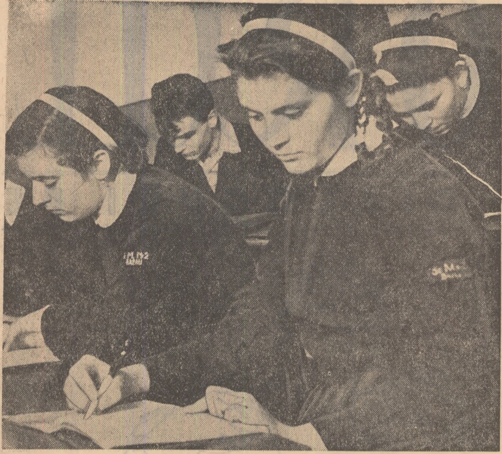
Tezele sînt în toi (La Școala medie nr. 2 „V. Alecsandri” din Bacău).