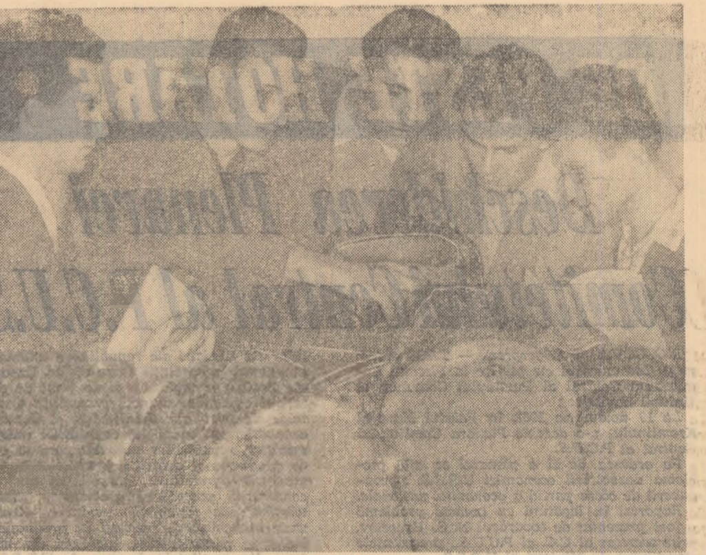
Studentii din anul V al Institutului Politehnic din Galați într-unul din laboratoarele de mașini.

acțiuni de muncă patriotică, cultural-artistice, sportive etc. În fața lor va fi expus un ciclu de conferințe despre drepturile și îndatoririle cetățenilor din patria noastră, despre importanța realizării ale regimului democrat-popular, despre profilul moral al tineretului din patria noastră, etc. În colaborare cu biblioteca regională, se vor organiza seri literare, se vor face recenzii la o seamă de cărți valoroase, înscrise în urmă. Activități interesante, dorite de tineri și necesare spiritului cunoștințelor lor, acum cînd sînt în preajma unui eveniment important din viața, au rămas închise în fișele unui dosar. Tinerii le așteaptă și e datorită comitetului orașenesc U.T.M. să traducă în viață propriul său plan. V. BARAC correspondentul „Științei tineretului” pentru regiunea Oltenia