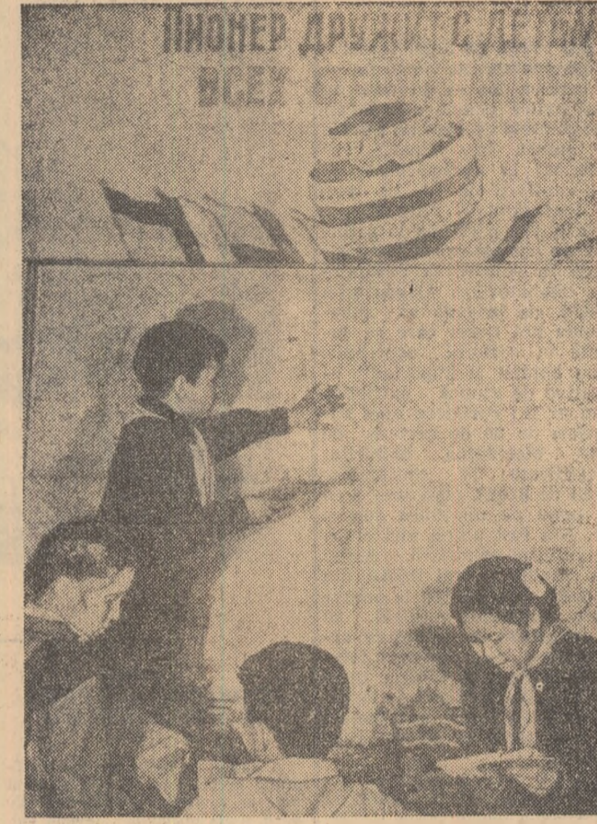
În orașul Hesaravile din R.S.S. Daghestan a luat ființă „Clubul prieteniei internaționale”. În fotografia de mai sus poartă în vîzual clipa din membrii acestui club care fac schimb de măști poștale, de cărți, insignă și corespondență cu linier din numeroase țări ale lumii.

7. — să înceteze suspendarea concesiilor obținute în forțele armate ale U.R.S.S.