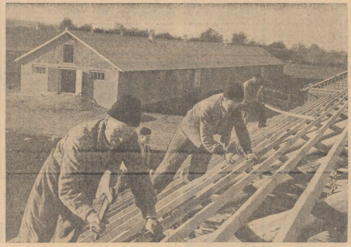
vreamea este bună. Așa că harnicii colectivști din comuna Dumbăveni, regiunea Suceava, se străduiesc să termine încă un grajd pentru animalele proprietate obștească.