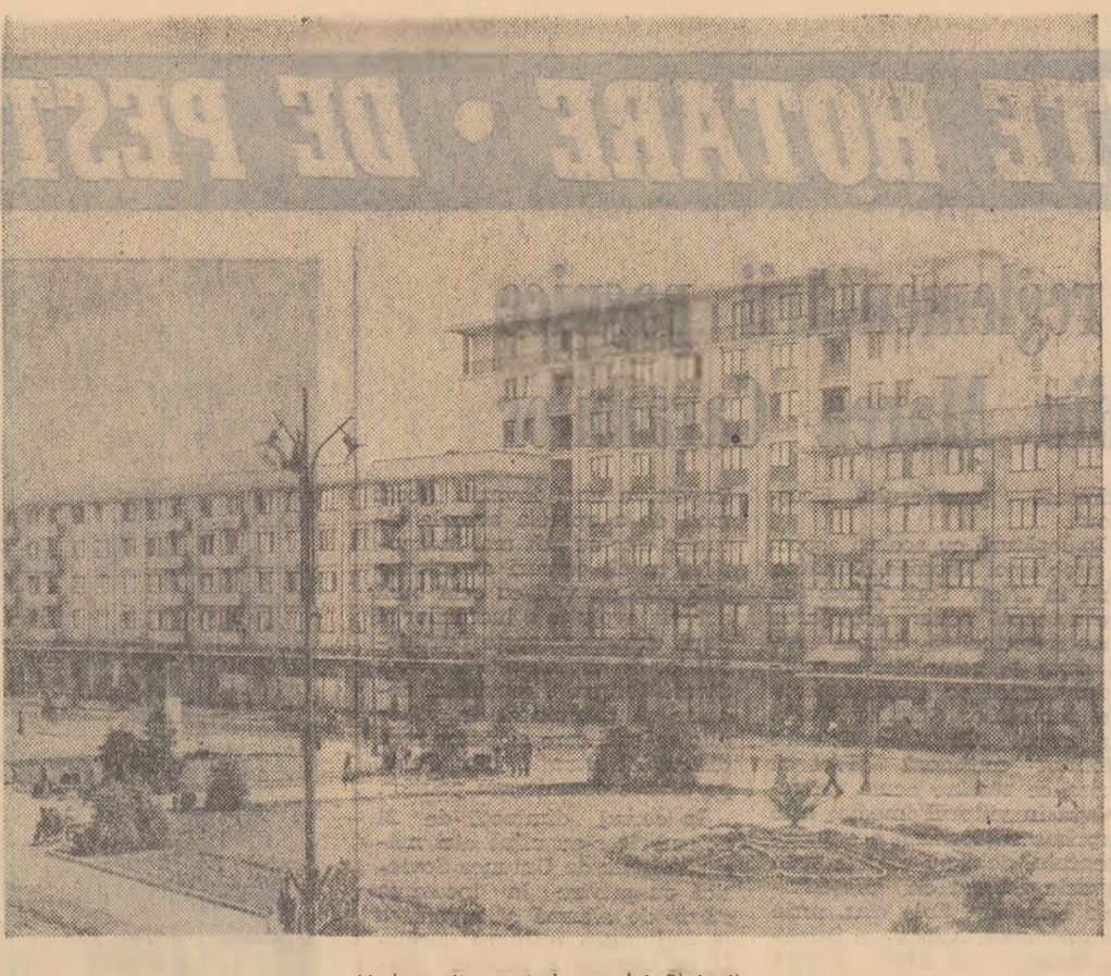
Vedere din centrul orașului Ploiești.

An de an studenții clujeni, ce și studenții din celelalte centre universitare, li se asigură condiții tot mai bune de viață. De pildă, încă de acum un an studenții clujeni li s-a pus la dispoziție un complex studențesc format din 10 cămine și o cantină. În fotografie: holul de intrare la cantina Complexului studențesc din Cluj.