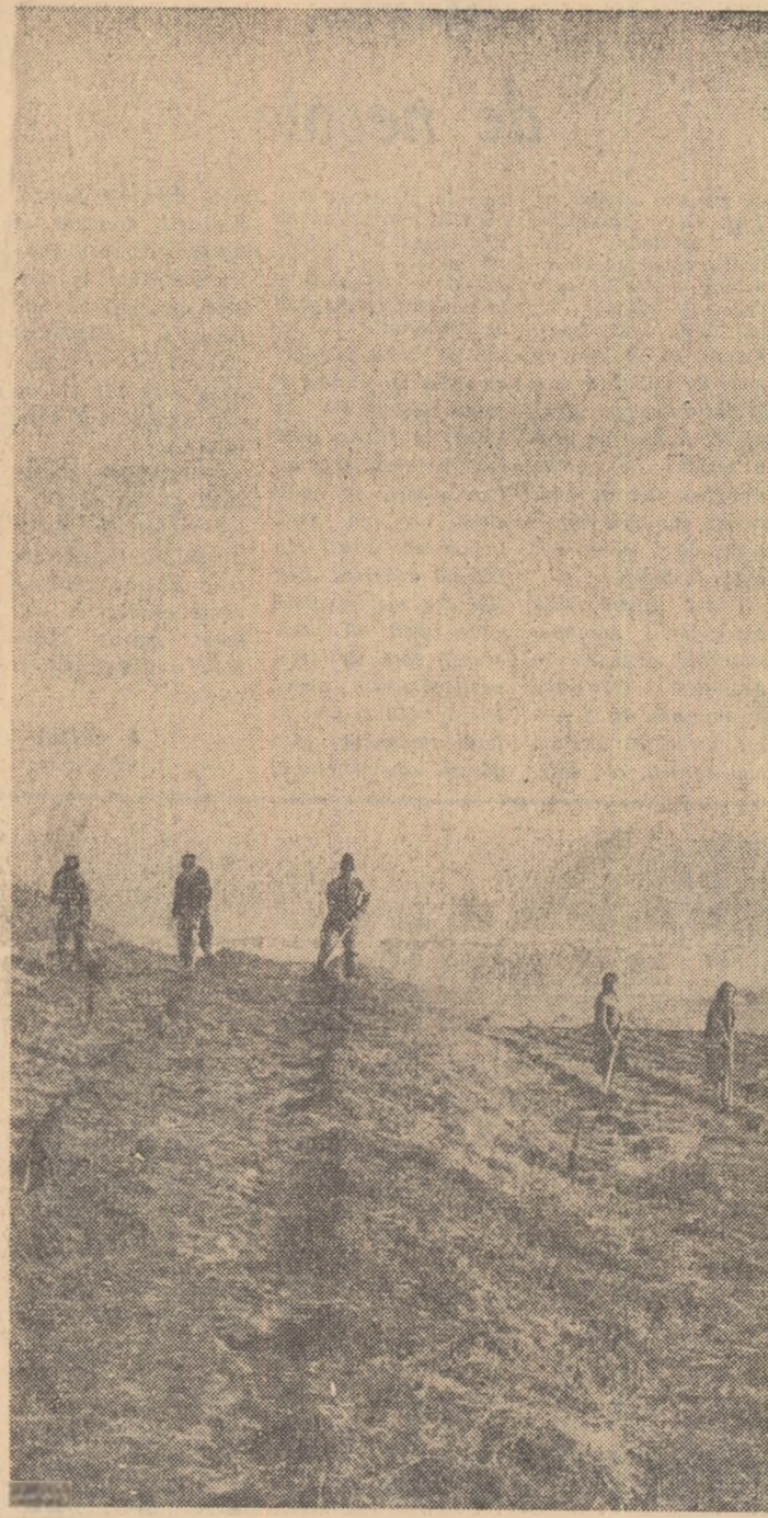
Numei cu un an de zile în urmă, pe aceste dealuri din împrejurimile comunei Burlești, regiunea Suceava, creșeau în voie spinii și scieșii. Mina harnică a colectivștilor însă le-a transformat din toamna aceasta în adevărate grădini, prin plantarea viței de vie în terase.

LAL ROMULUS corresponsentul „Scînteii tineretului” pentru regiunea Hunedoara