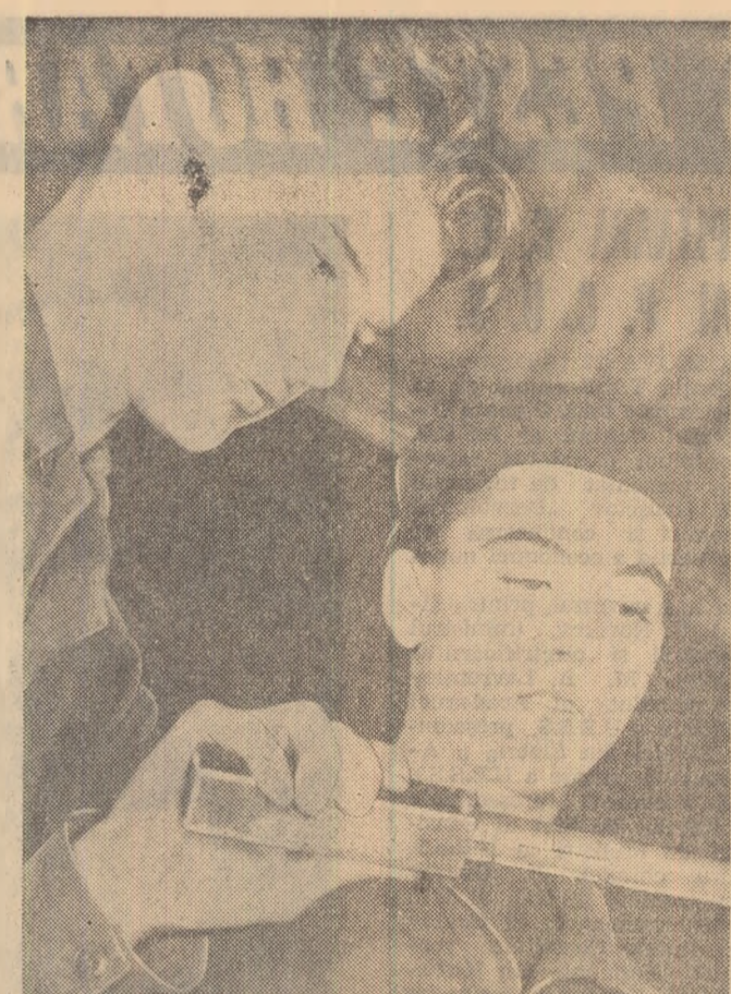
Împreună au absolvit școala profesională. Acum sînt muncitori la Uzinele mecanice din Timișoara...