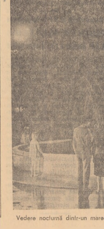
Vedere nocturnă dintr-un mare oraș? Nu! Un aspect obișnuit din centrul comunei Sînnicolau Mare.