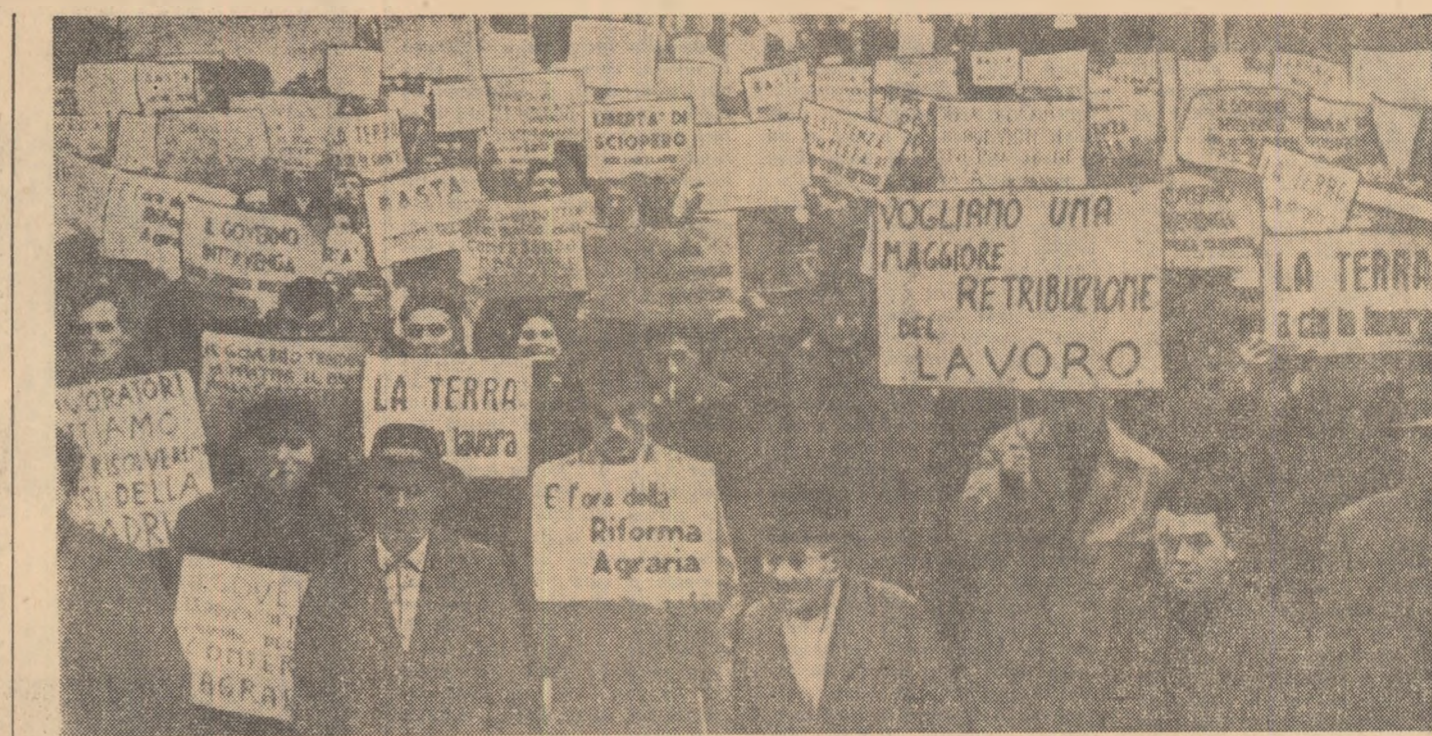
Ilalia. Aspect din timpul unei recente demonstrații ce s-a desfășurat la Ravenna împotriva poliției egare a guvernului.

PEKIN 22 (Agerpres). — După cum anunță ziarul „Jen-minjibao”, începînd de astăzi, adică de la 22 noiembrie 1962, detașamentele chineze de grăniceri au încetat din proprie inițiativă focul de-a lungul întregii linii a frontierei dintre China și India. Ziarul arată că peste noapte, adică la 1 decembrie, va începe re-