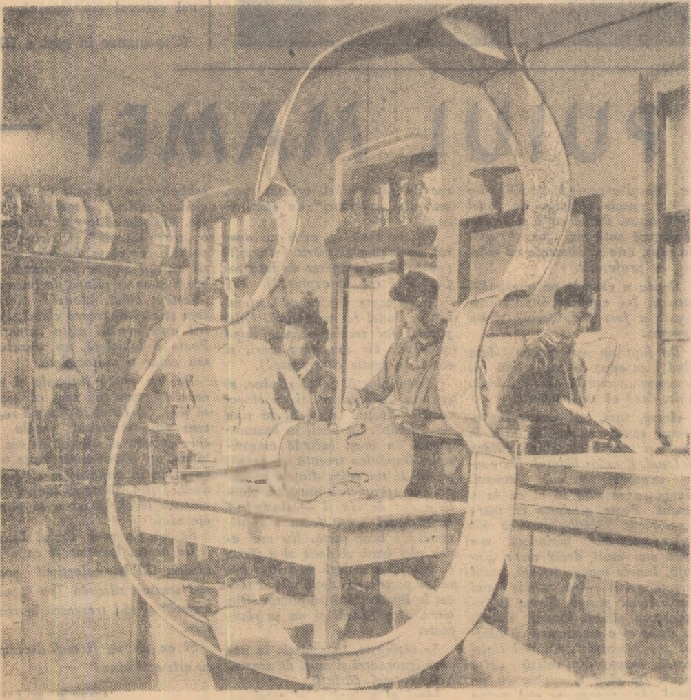
Nu va tece mult și din strunele violonilor la care acum lucrează muncitorii Fabricii de instrumente muzicale de la Reghin, vor ieși melodile cele mai frumoase.

Despre îngrijirea utilajului s-a vorbit in multe adunări generale la care au fost invitați și maiștri. Posturile utemiste de control au organizat numeroase raiduri in acest sens.