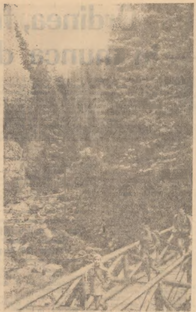
In drumetie pe Valea Ialomiei, prin Cheile Zănoagii.

sint tineri care n-au încă o atitudine socialistă față de muncă, care n-au o educație muncitorească corespunzătoare. Prezența la muncă este o îndatorire elementară. Sint muncitori in uzină, tineri și vîrstnici, care in ani și ani de cînd lucrează nu au lipsit și nu au întîrziat niciodată. Atunci cum se face că într-un colectiv sănătos există și asemenea manifestări? Este vorba de unele concepții inoportune din partea unor tineri, „ce dacă lipsesc o zi nu-i mare lucru”. Organizația U.T.M. a făcut multe lucruri bune pentru a educa la tineri trăsăturile muncitorului înaintat. In mare măsură a reușit. La începutul anului numărul absențelor nemotivate din rîndul tinerilor era mai mare. Realitatea arată însă că n-a făcut totul. Ori de cite ori un